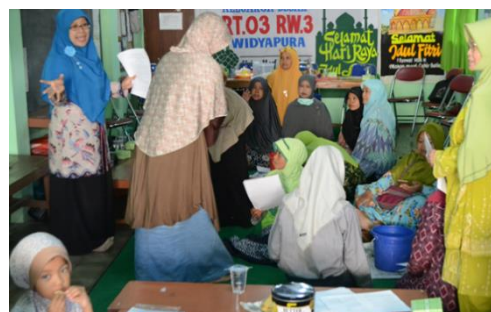
Gambar 2. Kegiatan Introduksi dan Induksi

Pada tahap pengembangan. kegiatan pengabdian ini terdapat beberapa stimulan yang bisa digunakan untuk memotivasi para anggota, antara lain adalah plastik yang siap pakai untuk menampung produk sabun cair yang sudah ada logonya, botol yang sudah berlogo. Stimulasi lain yang sedang dilakukan oleh tim pengusul adalah mencarikan hak paten atau ijin produksi untuk sabun cair ini sehingga penjualan di khalayak adalah legal.