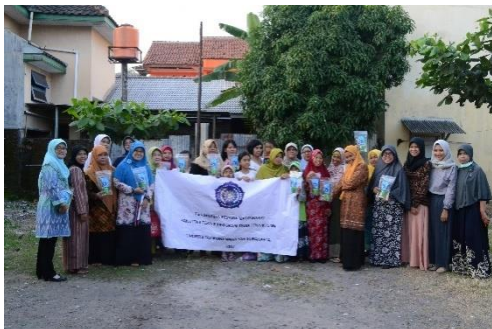
Gambar 5. Foto Kebersamaan Dengan Anggota Aisyiah