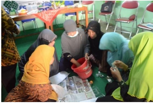
Gambar 3. Kegiatan Pembuatan Sabun Cair