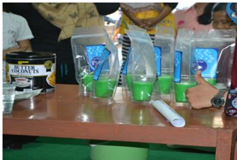
Gambar 4. Contoh Produk Sabun Cair Yang Telah Dibuat