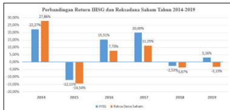
Gambar 1. 2 Perbandingan Return Reksa Dana Saham dan IHSG Tahun 2014-2019

Sumber: data yang diolah tahun 2019 ( juruscuan.com )