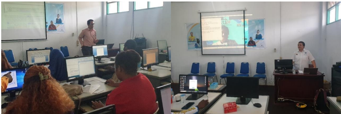
Gambar 2 . Proses pelatihan aplikasi digital

Materi pertama tentang penggunaan Microsoft Office dan Microsoft Excel untuk membuat dokumentasi surat menyurat, pelaporan kegiatan, laporan keuangan dan pembuatan presentasi. Kegiatan dilanjutkan dengan pelatihan penggunaan aplikasi video conference sebagai sarana rapat/pertemuan secara online . Materi terakhir adalah terkait dengan penggunaan media internet dan media sosial sebagai sarana promosi dan komunikasi berbagai kegiatan dan materi terakhir tentang cara pembuatan flyer dan video promosi. Dokumentasi kegiatan disajikan pada Gambar 2 .