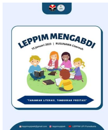
Gambar 3. Poster kegiatan LEPPIM mengabdikan

Sebelum melaksanakan pengabdian, terdapat publikasi poster kegiatan yang bertujuan untuk memberikan informasi kepada pihak terkait kegiatan dan masyarakat umum. Sama seperti poster open donasi, poster kegiatan juga diunggah di akun media sosial LEPPIM UPI Purwakarta, media kerja sama dan panitia. Poster kegiatan yang diunggah adalah seperti pada Gambar 3.