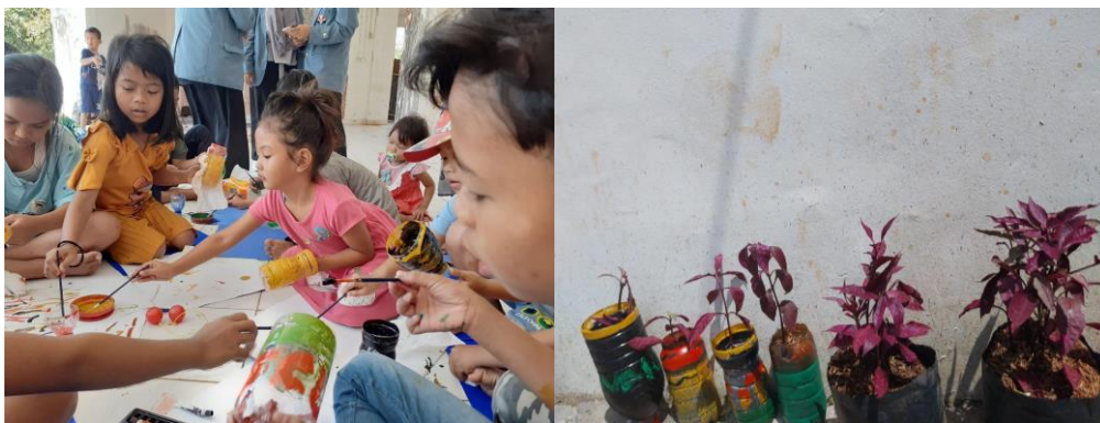
Gambar 6. Aktivitas melukis pot botol plastik bekas

melestarikan, merevitalisasi dan meningkatkan kondisi lingkungan (Kusumaningrum, 2018). Gambar 6 adalah potret dari kegiatan melukis pot dari botol plastik bekas yang dilakukan bersama-sama. Kegiatan tersebut dapat meningkatkan serta sebagai ajang mengekspresikan kreativitas anak. Botol plastik bekas pada dasarnya dapat diubah dalam bentuk kesenian apa saja yang tingkat kerumitannya harus sesuai dengan usia anak, seperti misalnya kreasi bunga (Derawati, 2021), tas plastik (Sayekti, 2015), busana (Valentina, 2016), pot atau vas bunga, mainan pesawat sederhana, wadah pensil (Sativa et al., 2023) dan masih banyak lagi. Pada pengabdian ini, penggunaan botol plastik bekas akan dikreasikan menjadi sebuah pot karena bentuknya sederhana dan mudah diikuti oleh anak-anak. Ini merupakan sebuah pembelajaran yang diberikan oleh anak-anak sasaran pengabdian agar memiliki kompetensi dalam mengonversi barang bekas menjadi objek yang bermanfaat atau berdaya guna. Upaya ini memberikan edukasi kepada siswa untuk mahir dalam mengolah sampah dan mengajarkan agar tidak membuat kerusakan di bumi (Maesaroh et al., 2021).