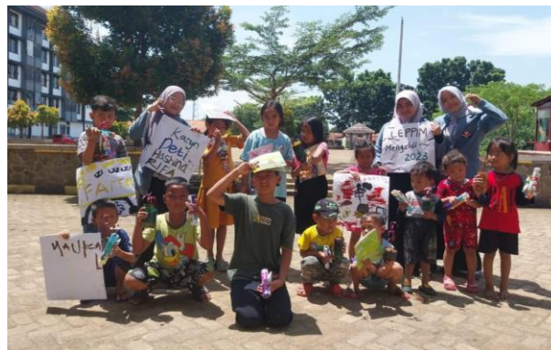
Gambar 7. Foto Bersama dengan anak-anak Rusunawa Kabupaten Purwakarta

Setelah melaksanakan semua rangkaian acara, tim pengabdian dan anak-anak Rusunawa melakukan foto bersama seperti pada Gambar 7. Dari gambar tersebut anak-anak terlihat antusias atas kegiatan yang telah diikutinya. Saat penutupan kegiatan pengabdian ini, sebagian besar anak-anak menyampaikan perasaan bahagianya atas terselenggaranya kegiatan ini. Adapun yang menyampaikan untuk mengadakan kegiatan pembelajaran ini setiap pekan. Tim pengabdian tidak menyangka atas respon positif yang disampaikan oleh anak-anak mengenai antusiasmenya.