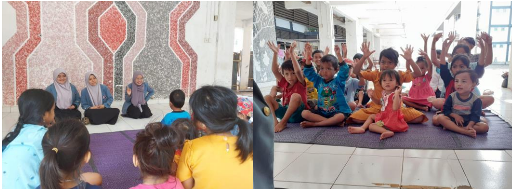
Gambar 4 . Dokumentasi kegiatan pembukaan pengabdian

Kegiatan dimulai pada 08.30 WIB, diawali dengan pembukaan yang dibawakan secara informal dan santai oleh tim pengabdian. Anak-anak terlihat bersemangat mengikuti pembukaan ini karena diselingi dengan nyanyian atau yel-yel seperti Gambar 4 . Setelah pembukaan, diadakan senam bersama sebagai pemanasan dan menjalin keakraban antara tim pengabdian dengan anak-anak. Kegiatan pengabdian ini terdiri dari beberapa aktivitas seperti senam pagi bersama, ice breaking , melukis pot bersama, menanam bersama dan aktivitas inti dari pengabdian ini adalah reading aloud .