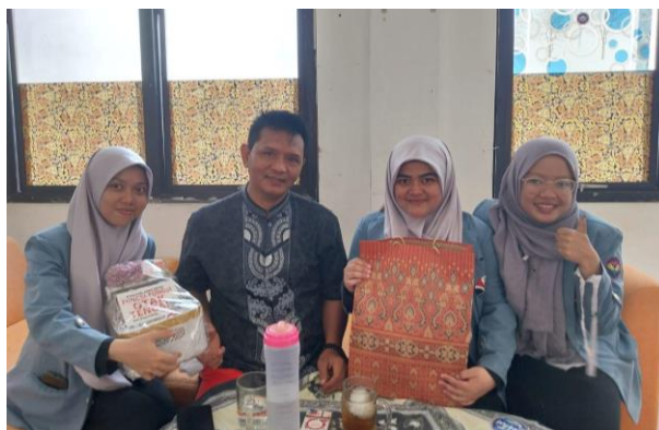
Gambar 8. Penyerahan buku kepada pengurus Rusunawa

dapat menjadi buku tambahan bagi perpustakaan rusunawa. Perpustakaan merupakan tempat yang dapat dijadikan sebagai fasilitas dalam kegiatan pengoptimalan potensi literasi warga (Fatimah et al., 2021; Purwantini et al., 2021). Buku-buku yang diberikan terdiri dari buku pengetahuan umum, novel dan buku cerita anak (Gambar 8).