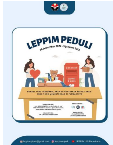
Gambar 2. Poster kegiatan untuk open donasi

ini juga dilakukan oleh media kerja sama kegiatan, seperti BEM UPI Purwakarta, HIMA PSTI UPI Purwakarta, dan SIEP sehingga penyebaran akan semakin luas.