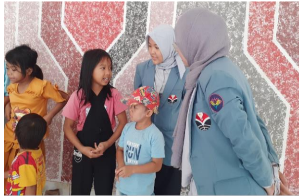
Gambar 5. Kegiatan reading aloud

cerita yang akan didengarkan. Reading aloud ini juga mengaitkannya dengan kehidupan sehari-hari. Saat membacakan cerita, pemandu akan menyelingi dengan pertanyaan-pertanyaan kecil mengenai cerita yang anak dengarkan. Hal tersebut dapat meningkatkan ketertarikan terhadap cerita yang didengarkan. Selain itu, terbangun suasana yang interaktif antara pemandu dengan para pendengarnya yaitu anak-anak. Reading aloud dengan interaktif dapat menstimulus anak untuk aktif mendengarkan, berpikir kritis dan berani menyampaikan pendapat sehingga anak mampu memahami bacaan dan dapat mengembangkan kemampuan berbahasa (Sandy et al., 2021).