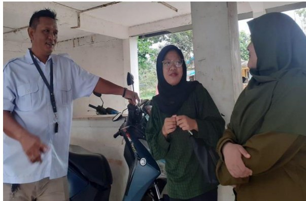
Gambar 1 . Dokumentasi tim melakukan perizinan dengan pihak Rusunawa

Pertama adalah tahap perencanaan, tahap ini membahas konsep pelaksanaan, seperti rangkaian kegiatan, rincian perlengkapan yang dibutuhkan dan pemilihan panitia dan tim pengabdian. Perencanaan ini diikuti oleh ketua BSO LEPPIM UPI Purwakarta, ketua departemen pengabdian dan pengembangan pada masyarakat, ketua pelaksana pengabdian, dan anggota DP2M LEPPIM UPI Purwakarta. Tahap kedua, melakukan perizinan dengan pihak Rusunawa seperti Gambar 1 . Tahap ketiga, mengadakan penggalangan dana secara online . Penggalangan dana ini dilakukan untuk menghimpun dana yang akan diberikan kepada target dan sasaran kegiatan berupa buku, perlengkapan sekolah dan hadiah yang berbentuk makanan ringan.