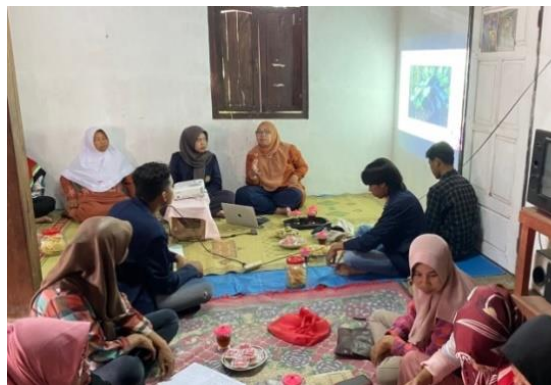
Gambar 2. Kegiatan sosialisasi ketahanan pangan

Sosialisasi tentang ketahanan pangan pada keluarga dengan stunting dilaksanakan pada tanggal 8 Januari 2023 yang diikuti oleh ibu-ibu KWT Dusun Siyangan sebanyak 30 orang yang disajikan Gambar 2 . Kegiatan ini bertujuan agar para ibu-ibu bisa mengolah sumber makanan dengan baik tanpa mengurangi kandungan dalam sayur, lauk maupun buah. Kegiatan ini diharapkan dalam dilaksanakan secara berkesinambungan dan dapat mengajak masyarakat untuk meningkatkan ketahanan gizi pada keluarga.