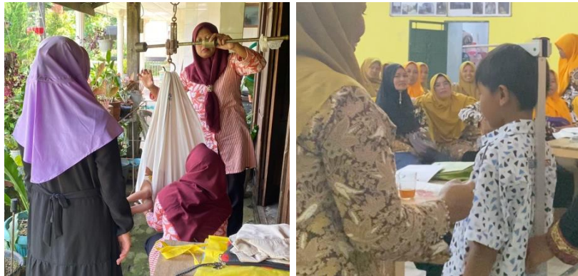
Gambar 3. Kegiatan pelatihan dan pendampingan posyandu

lingkar kepala. Lalu hasilnya dituliskan di buku KMS. Setelah itu dibagikan PMT susu kacang hijau, roti dan nasi sayur sop. Dalam kegiatan tersebut diharapkan para kader dapat melakukan pengukuran dengan benar sesuai SOP.