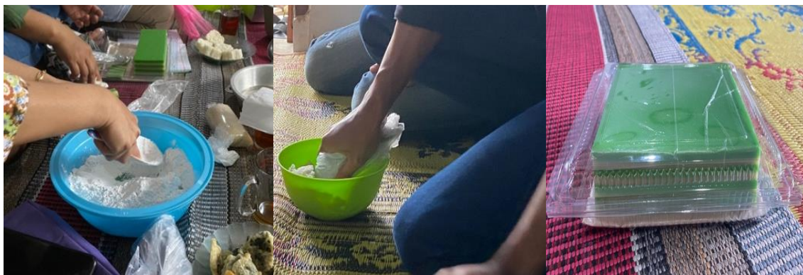
Gambar 4. Proses pembuatan kue lapis talas