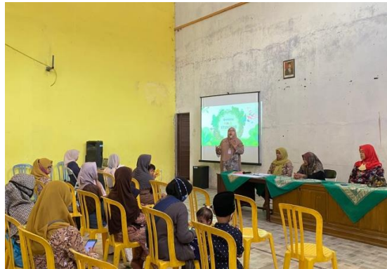
Gambar 1. Kegiatan sosialisasi stunting

Sosialisasi tentang stunting dilaksanakan pada tanggal 6 Januari 2023 yang diikuti oleh 25 ibu dan anak dengan stunting di balai Desa Kebonagung terlihat pada Gambar 1 . Pada kegiatan ini dipaparkan tentang stunting yang bertujuan agar orang tua anak dengan stunting memahami terkait stunting , penanganan dan pemberian nutrisi yang baik. Dalam kegiatan tersebut didapatkan peningkatan informasi mengenai stunting dan mengetahui tanda dan gejala stunting dan mengetahui berat badan ideal dan tinggi badan ideal untuk usia balita normal dan stunting .