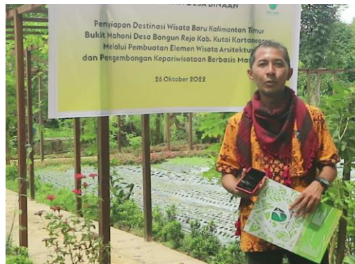
Gambar 3. Taman Bunga di sekeliling pergola

Selain Pergola, juga didukung dengan taman bunga di sekelilingnya. Tim Pengabdian melakukan penggambaran desain taman bunga berupa penataan lanskapnya. Taman bunga ini menjadi elemen penyegar bagi Kawasan, dikarenakan Bukit Mahoni ini merupakan area yang dipenuhi oleh pepohonan besar dan tinggi saja. Konsep dari taman bunga ini adalah menampilkan warna-warni yang alami dari bunga yang ditanam (Gambar 3).