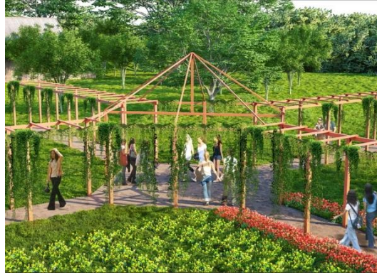
Gambar 2. Desain Pergola di Bukit Mahoni Bangun Rejo