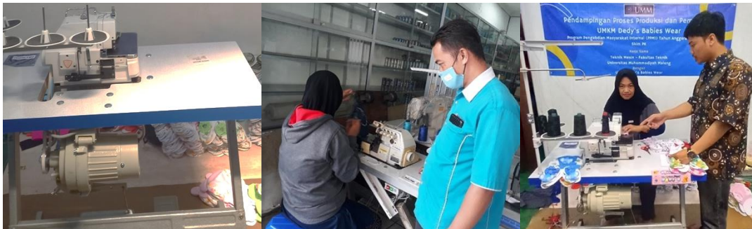
Gambar 1. Pendampingan dan pelatihan penggunaan mesin obras

Tim pengabdian memberikan bantuan alat berupa mesin obras. Selanjutnya, juga diberikan pendampingan dan pelatihan penggunaan alat ( Gambar 1 ). Mesin obras yang digunakan adalah benang 5 yang mempunyai keunggulan untuk menjahit dan mengobras. Hal ini tentunya dapat meningkatkan efisiensi proses produksi mitra.