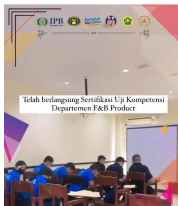
Gambar 6. Pelaksanaan uji kompetensi oleh Lembaga Sertifikasi Profesi Pariwisata Bali Internasional

Uji kompetensi ini dilakukan dalam bentuk ujian praktik di setiap departemen dengan asesor yang telah diutuskan oleh LSP Par BI. Dari hasil evaluasi ini kita juga bisa melihat bagaimana dampak dan pengaruh dari kegiatan ini bagi peserta dan masyarakat Desa Kenderan ke depan dalam meningkatkan kualitas sumber daya manusia akan hospitality atau pelayanan service untuk menunjang kemajuan pariwisata di desa wisata Kenderan di masa mendatang. Hasil evaluasi ini digunakan juga untuk melakukan tindakan perbaikan dan bahan refleksi dalam kegiatan PKM selanjutnya.