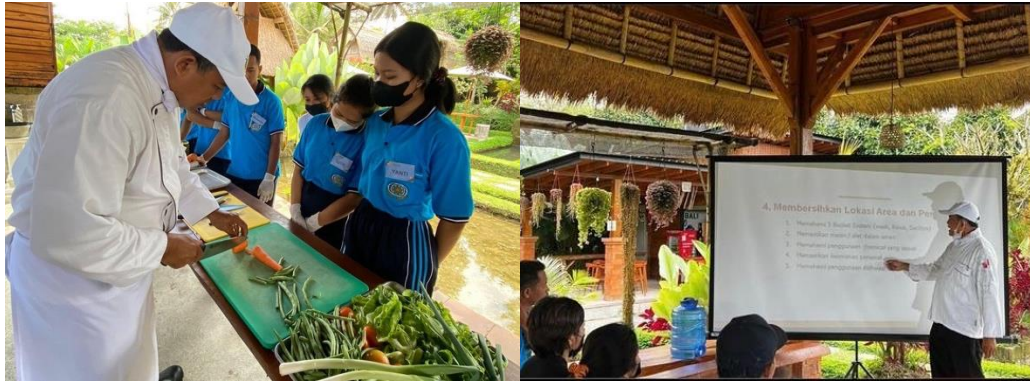
Gambar 5. Kegiatan pelatihan tata boga (F&B product)