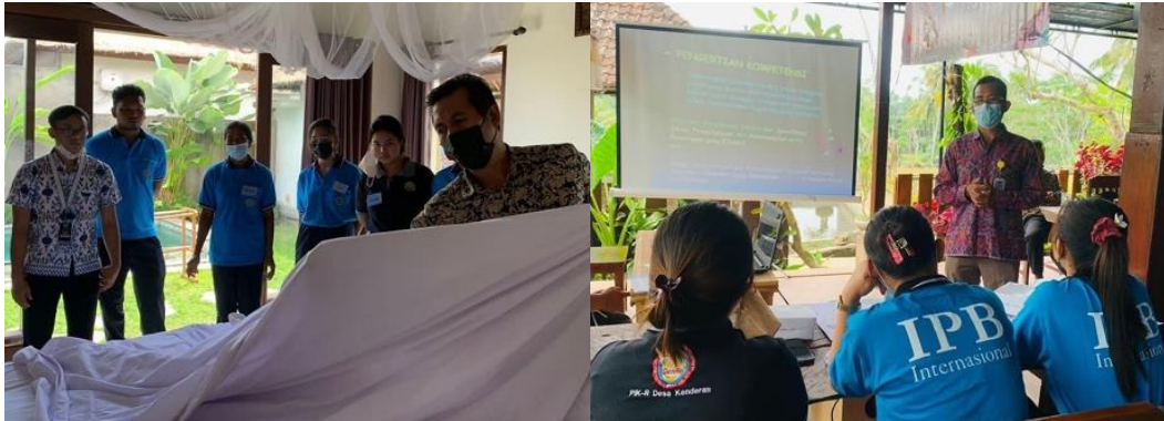
Gambar 3. Kegiatan pelatihan departemen tata graha ( housekeeping )