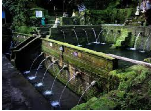
Gambar 1. Telaga Waja di Desa Kenderan, Tegallalang

Terdapat beragam aktivitas wisata yang dapat dilakukan di Desa Kenderan diantaranya jungle tracking , painting classes , blessing holy water , cycling , homestay dan meditasi. Daya tarik wisata di Desa Kenderan adalah alamnya yang indah memiliki keunikan sendiri. Dengan adanya homestay yang dikelola oleh warga Desa Kenderan sendiri, setidaknya anak-anak muda dapat mengelola usaha mereka sendiri dengan memanfaatkan pengetahuan dan keterampilan yang mereka miliki. Namun tidak semua anak muda di Desa Kenderan ini memiliki pengetahuan/kemampuan khususnya di bidang Hospitality sehingga perlu diberikannya pemahaman dan pelatihan terkait bidang hospitality ini.