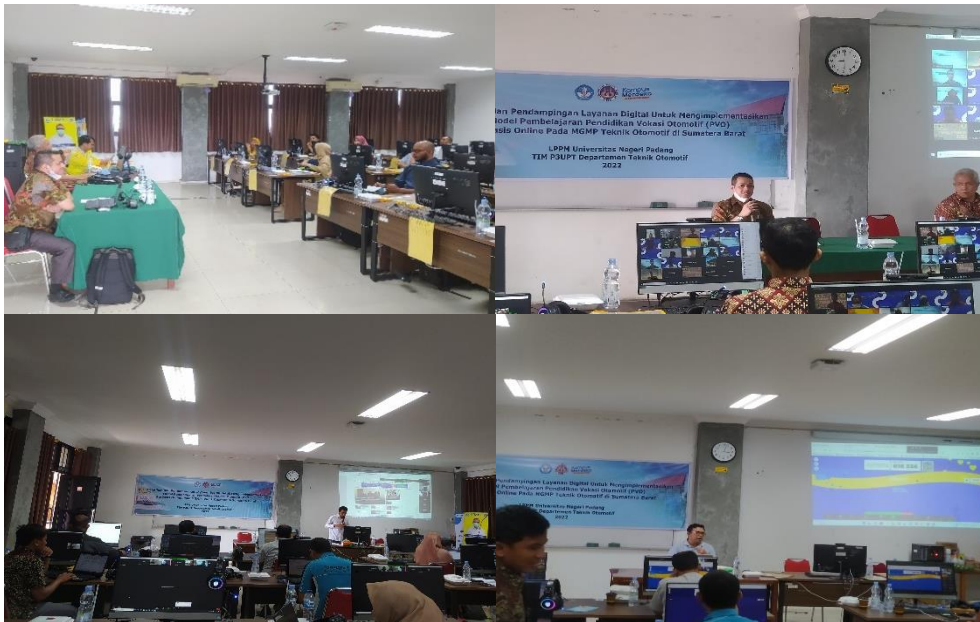
Gambar 1. Dokumentasi pelatihan

Kegiatan pelatihan terdokumentasi seperti terlihat pada Gambar 1 . Terlihat pelatihan dan pendampingan yang dilakukan adalah untuk memecahkan permasalahan yang telah dikemukakan sebelumnya yaitu kegiatan ini dimaksudkan agar guru-guru memiliki wawasan yang memadai akan sistem teknologi dan informasi.