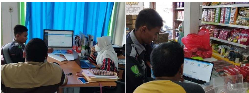
Gambar 2. Kegiatan sosialisasi dan edukasi e-commerce kepada UMKM

Tanggapan mereka setelah melakukan sosialisasi dan edukasi dalam pengoperasian aplikasi berbasis website eAmplang ini sangat bagus bahkan setelah melakukan sosialisasi mereka langsung menggunakannya. Hal ini menunjukkan bahwa pengabdian sangat bermanfaat bagi UMKM, khususnya UMKM amplang Sinar Terang dan UMKM amplang najwa. Keberadaan website ini memberikan dapat signifikan dalam proses bisnis UMKM yang beralih dari model konvensional yang sebelumnya digunakan. Kedua UMKM ini biasanya memasarkan produk dengan menitipkan produk ke toko lain dan brand asli tidak digunakan. Hal ini berdampak pada ketidaktahuan pasar terhadap produsen asli sehingga kesulitan untuk meningkatkan pendapatan secara signifikan. Kegiatan sosialisasi dan edukasi disajikan pada Gambar 2 .