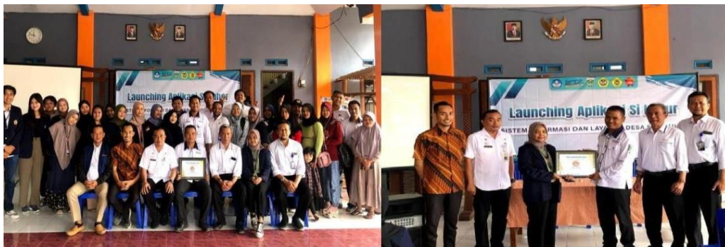
Gambar 5. Launching aplikasi SI LUHUR

Setelah dilaksanakan pelatihan maka kegiatan dilanjutkan dengan Launching Aplikasi SI LUHUR pada Rabu, 6 November 2022 (Gambar 5). Kegiatan ini bertempat di Balai Desa Sidoluhur dengan dihadiri oleh Tim PPK Ormawa HMJ Administrasi Publik, anggota ormawa (yang tidak masuk kedalam Tim), Perangkat Desa, Kepala Desa, Sekretaris Camat Lawang, perwakilan masyarakat desa yang diwakili kader-kader desa dari setiap dusun, dosen pendamping, Kaprodi Administrasi Publik, dan Wakil Dekan 1 FISIP.