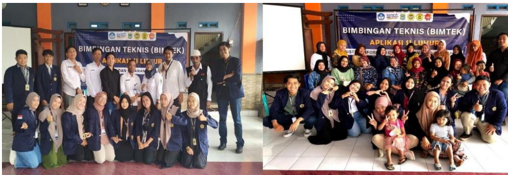
Gambar 4. Pelatihan/bimbingan teknis aplikasi SI LUHUR

Pelatihan Modul 2 ini dikonsepsi menjadi BIMTEK, karena memang dalam kegiatannya adalah praktik langsung penggunaan dan pengoperasian dari Aplikasi SI LUHUR (Gambar 4). Kegiatan ini memberikan manfaat peningkatan kapasitas penggunaan aplikasi pelayanan dalam rangka penerapan digitalisasi (Hanun et al., 2021). Kegiatan ini dilaksanakan selama 2 hari. Hari pertama (26 Oktober 2022) adalah Bimtek dengan peserta perangkat desa. Tidak hanya yang menjadi operator/admin saja yang mengikuti Bimtek, namun seluruh perangkat desa mengikuti kegiatan ini agar perangkat desa juga mengetahui pengoperasian aplikasi SI LUHUR. Hari kedua (27 Oktober 2022) adalah Bimtek dengan peserta masyarakat desa yang dipelopori oleh kader-kader Desa Sidoluhur. Kader desa didominasi oleh kaum perempuan. Tidak mengherankan karena menurut Dwinugraha (2019) keterlibatan perempuan di desa menjadi salah satu faktor pendukung untuk meningkatkan penyelenggaraan pelayanan desa yang baik. Pada pelatihan ini masyarakat dilatih dalam pendaftaran akun, mekanisme pelayanan, dan pengajuan dokumen. Terdapat kendala sinyal dalam pelaksanaan bimtek tidak membuat antusiasme dari peserta pelatihan ini berkurang. Partisipasi dan dukungan dari pemerintah desa dan masyarakat desa menuju Desa Digital ini sangat terlihat.