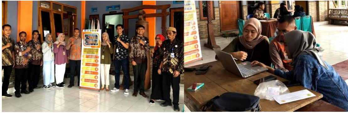
Gambar 2. Kegiatan pembuatan aplikasi

Sebelum dilakukan peluncuran atau launching aplikasi, maka aplikasi tersebut mendapatkan konfirmasi dengan kominfo terkait adanya aplikasi terkait digitalisasi yang ada di kantor Desa Sidoluhur. Serta sebagai bentuk dalam legalitas aplikasi yang akan digunakan. Pada proses legalitas aplikasi, tim mengajukan agar aplikasi SI LUHUR ini tertanam dalam server Kominfo agar nantinya setelah kegiatan selesai terdapat bantuan dari pihak Kominfo agar tetap memantau perkembangan aplikasi tersebut. Pada akhir pertemuan diperoleh kesepakatan bahwa Aplikasi SI Luhur mendapatkan legalitas dan server diletakkan di Kominfo dengan alamat website https://siluhur.malangkab.go.id/ .