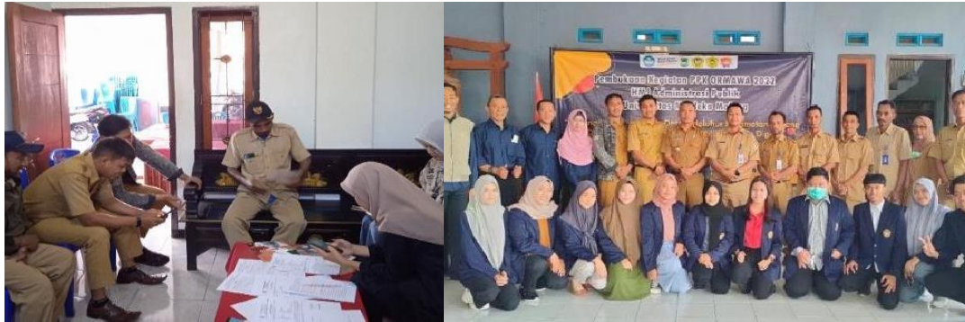
Gambar 1. Kegiatan sosialisasi dan pembukaan perangkat desa

peningkatan literasi digital dari para perangkat desa dan masyarakat desa (Husna et al., 2021). Sekaligus dengan melakukan kegiatan pembukaan PPK Ormawa.