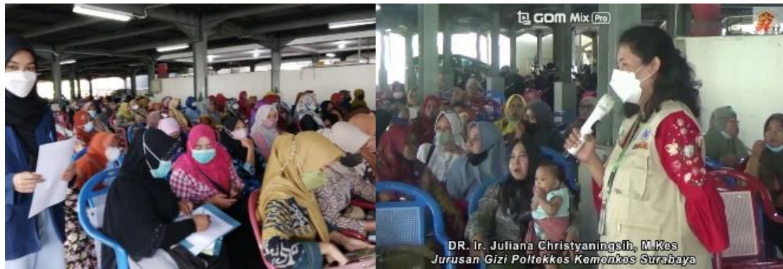
Gambar 1. Sosialisasi dan penyuluhan manfaat konsumsi daun kelor dan ikan