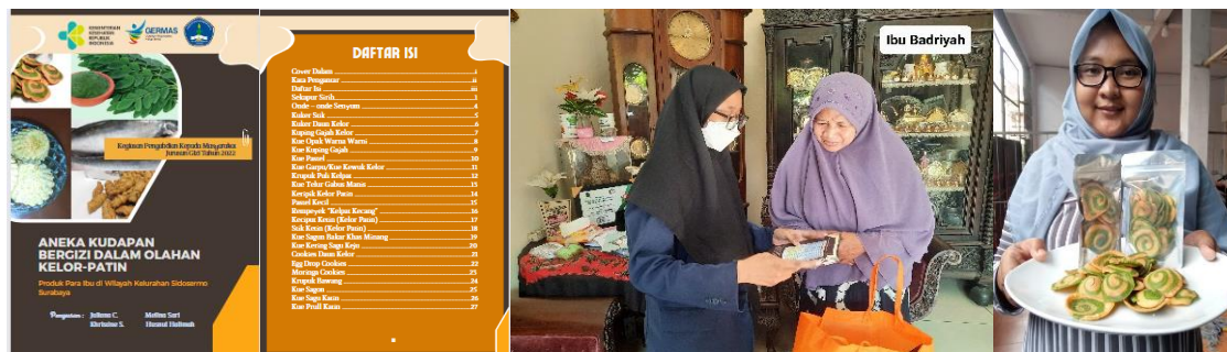
Gambar 2. Buku resep sebagai hasil pelatihan