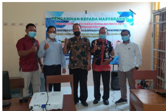
Gambar 2. Trainer bersama Ketua MGMP SMP Bahasa Jawa Kabupaten Purworejo

Kegiatan pelaksanaan pada tahap ini, dilaksanakan di SMP N 13 Purworejo pada 3 Februari 2022. Kegiatan pelaksanaan pelatihan pembuatan modul ajar berbasis flipbook diikuti oleh 16 peserta, beserta tim pengabdian dan trainer pada kegiatan pelatihan. Kegiatan pelaksanaan dimulai dari pengarahan Ketua MGMP dan Ketua Tim Pengabdian. Setelah arahan dan sambutan ketua MGMP, diakhiri sesi foto bersama trainer, ketua MGMP dan didampingi oleh Kepala Sekolah SMP N 13 Purworejo seperti terlihat pada Gambar 2 . Pemberian materi oleh tim pengabdian kepada peserta, dimulai dari pemberian materi pertama tentang Pembuatan Media Pembelajaran Modul Digital Berbasis Flipbook oleh Dr. Aris Aryanto, M.Hum. Materi kedua disampaikan oleh Dr. Yuli Widiyono, M.Pd. dengan judul Pelatihan Penulisan Modul Bagi Guru Bahasa Jawa SMP. Materi ketiga dengan judul Pengembangan Modul Pembelajaran dengan Flipbook oleh Murhadi, S.Pd.T., M.Eng. Materi tentang pengembangan Flipbook yang meliputi tahapan dalam pengembangan modul ajar melalui flipbook. Implementasi pengembangan Modul Ajar berbasis flipbook dilakukan melalui tahapan penginstalan aplikasi pada perangkat untuk mendukung pembuatan modul ajar berbasis flipbook.