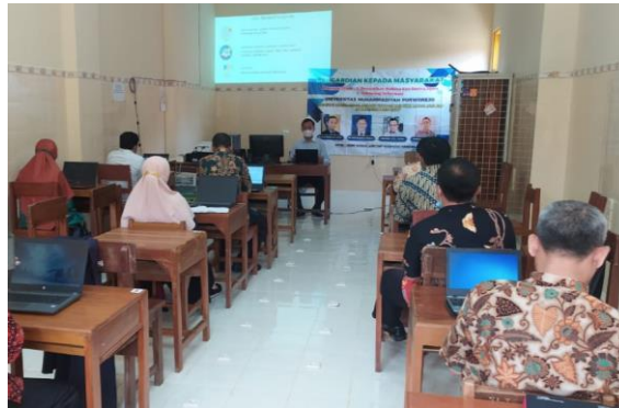
Gambar 3. Diskusi dengan peserta

Sharing informasi hasil pelaksanaan pembelajaran serta diskusi untuk memecahkan permasalahan yang dihadapi guru. Pemateri atau trainer memberikan pendampingan tata cara pembuatan flipbook. Jika ada salah satu guru yang mengalami kesulitan dan menyampaikan pertanyaan, langsung ditindaklanjuti oleh trainer. Seperti dapat dilihat pada Gambar 3 . Kesulitan yang dihadapi oleh guru, seperti belum bisa mengikuti petunjuk trainer ketika menjalankan program pembuatan flipbook. Solusinya, trainer mengulang-ulang sampai semua guru dapat menjalankan program pembuatan flipbook dengan baik. Selain itu, sesekali trainer secara langsung membantu guru mengoperasikan program flipbook.