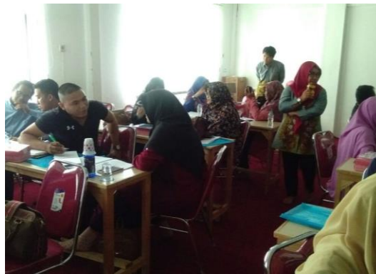
Gambar 4. Praktik konseling tersupervisi

Kegiatan ini dilaksanakan oleh pelaksana kegiatan pada tanggal 23 Mei 2022 di kampus Universitas Islam Kalimantan Muhammad Arsyad Al Banjari. Pada kegiatan ini, sebanyak 39 Guru SD mengikuti kegiatan. Topik yang dibahas dalam kegiatan ini berfokus pada simulasi dan praktik konseling singkat dalam ruangan yang diamati langsung oleh tim pelaksana kegiatan. Durasi pelaksanaan kegiatan ini adalah 120 menit. Gambar 4 memperlihatkan kegiatan ketika peserta didampingi oleh tim pelaksana pengabdian kepada masyarakat sebagai fasilitator simulasi konseling. Kegiatan diakhiri dengan diskusi interaktif antara peserta dengan fasilitator.