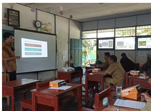
Gambar 6. Pelatihan menyusun laporan konseling

Penyampaian materi tentang tata cara menyusun laporan konseling telah dilaksanakan pada tanggal 20 Juni 2022 di SD Negeri Tinggiran Baru 2 (Gambar 6). Dalam kegiatan ini, tim pelaksana kegiatan menyampaikan materi tentang cara-cara menyusun laporan konseling sebagai syarat administratif pelaksanaan konseling individual di sekolah berdasarkan Panduan Operasional Penyelenggaraan Bimbingan dan Konseling di Sekolah Dasar (POP-BK SD) tahun 2016. Adapun materi yang disampaikan oleh tim adalah: (1) Urgensi pelaporan konseling individual di sekolah, (2) Elemen kunci laporan konseling individual, (3) Praktik penyusunan laporan konseling individual.