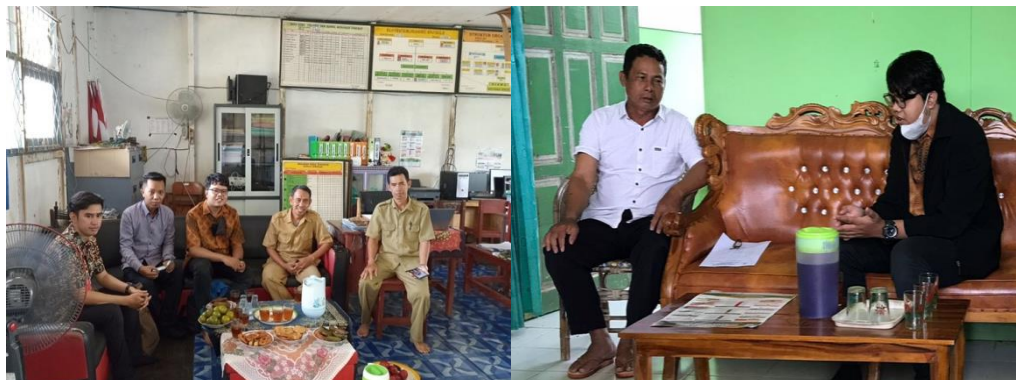
Gambar 5. Kunjungan supervisi praktik konseling mandiri

untuk merekam video praktik konseling mereka untuk ditunjukkan pada sesi terakhir pelatihan.