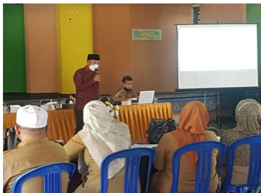
Gambar 1. Sosialisasi kebijakan awal