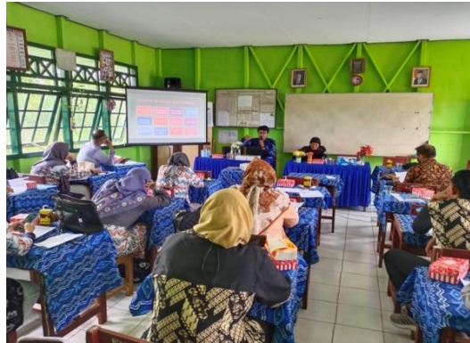
Gambar 3. Pelatihan konseling singkat

materi dari narasumber, peserta juga mendapatkan kesempatan untuk diskusi, melihat demonstrasi konseling, dan simulasi.