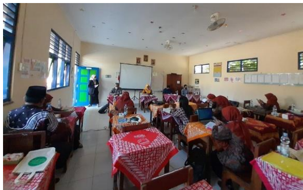
Gambar 2. Kegiatan pelatihan konsep pendidikan inklusif

Kegiatan pelatihan sebagai bagian dari program pengabdian ini dilaksanakan selama dua hari pada 7-8 Juli 2022 bertempat di SD 2 Petir. Pada hari pertama, pelatihan ditujukan untuk memberikan pemahaman kepada pengawas, kepala sekolah dan guru SD 2 Petir tentang pentingnya pendidikan inklusif dan landasan hukumnya sebagai amanat undang-undang. Alasan pengelola satuan pendidikan seperti kepala sekolah dan pengawas dihadirkan dalam pelatihan ini adalah bahwa pendidikan inklusif merupakan sebuah sistem pendidikan yang membutuhkan dukungan dari stakeholder yaitu pengawas dan manajer, dalam hal ini kepala sekolah. Memberikan pemahaman tentang konsep pendidikan inklusif beserta landasan hukumnya kepada pengelola sangat penting selain untuk membangun kesadaran tentang pentingnya pendidikan inklusif juga memberikan pengetahuan tentang manajemen sekolah inklusif yang ideal dan langkah-langkah dalam mewujudkan sekolah inklusif.