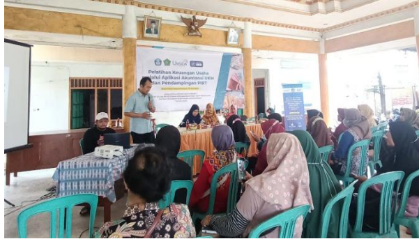
Gambar 4. Kegiatan pendampingan PIR-T

pencantuman kode PIRT, makanan dan minuman produk UMKM Gambir Anom akan lebih mudah dipasarkan dan lebih disukai konsumen hingga bisa meningkatkan daya jual. Hal ini juga menghindari sanksi administrasi atas kasus-kasus seperti melanggar peraturan di bidang pangan, nama pemilik tidak sesuai dengan yang ada di sertifikat, produk tidak aman dan tidak layak dikonsumsi. Selain itu produk – produk olahan pangan UMKM Gambir Anom juga bisa mengikuti pameran yang disediakan Dinas Koperasi dan Usaha Mikro Kabupaten Sidoarjo. Salah satu contoh P-IRT dari mitra binaan dapat dilihat pada Gambar 5 .