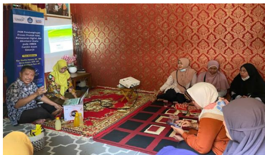
Gambar 2. Kegiatan pelatihan produk halal

Mitra diberi pelatihan terkait bahan-bahan apa saja yang dapat dipastikan kehalalannya, bagaimana memprosesnya sehingga bebas dari titik kritis halal, kegiatan ini ditunjukkan pada Gambar 2. Hasil olahan pangan berupa stik bayam, keripik gayam, sinom, susu sari kedelai dan produk-produk mitra juga akan didampingi untuk dapat memperoleh sertifikat halal melalui pengajuan ikrar/akad self declare , pengajuan ini ditunjukkan pada Gambar 3. Pengajuan sertifikat halal ini juga di dukung oleh Halal Center UMSIDA. Dimana tim pengusul merupakan pendamping proses produk halal (PPH) yang telah mengikuti pelatihan pendamping PPH yang diadakan BPJH Kementerian Agama Republik Indonesia.