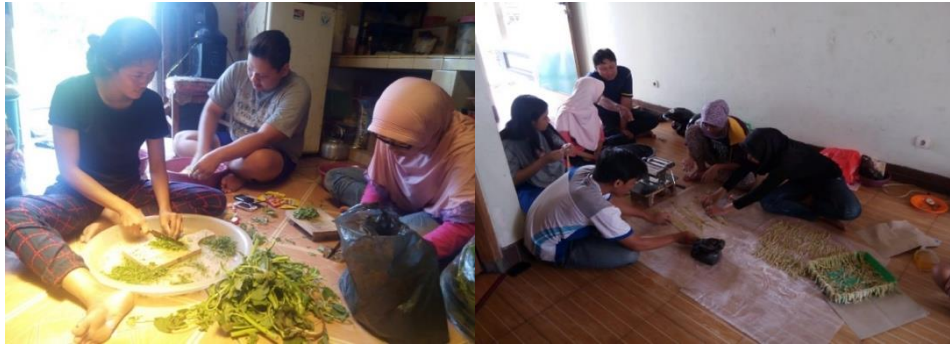
Gambar 1. Kegiatan UMKM Gambir Anom saat memproduksi stik bayam

Kegiatan usaha Kelompok UMKM Gambir Anom semenjak pandemi mengalami penurunan penjualan. Hal ini disebabkan oleh beberapa faktor. Faktor pertama dari sisi produksi. Mitra masih menggunakan cara konvensional dalam proses produksi. Dimana stik dan keripik masih dipotong manual. Sehingga hasilnya tidak rapi, ada yang terlalu panjang dan pendek. Bukan hanya itu hasil stik atau keripik juga kurang kriuk sebab hanya ditiriskan secara konvensional. Produk UMKM Gambir anom berupa minuman sinom dan sari kedelai juga dihadapkan hal yang serupa. Kadar endapan sari sinom dan sari kedelai juga masih banyak serta belum memiliki varian kemasan yang menarik pembeli. Kebijakan pemerintah yang akan mewajibkan seluruh UMKM makanan dan minuman untuk bersertifikat halal pada tahun 2024 semakin membuat mereka resah. Mitra belum memahami bagaimana proses produksi produk halal sehingga produk mitra dapat tersertifikasi halal.