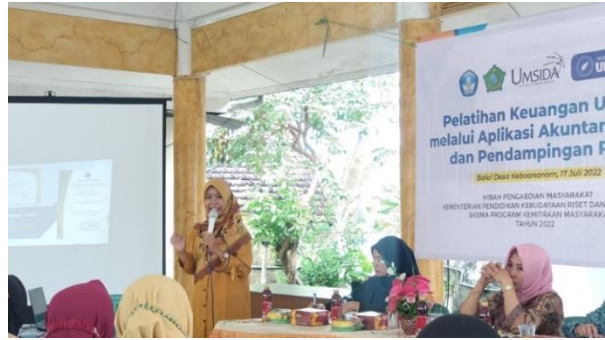
Gambar 6. Pelatihan aplikasi Akuntansi UKM