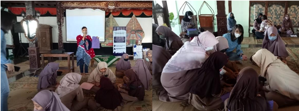
Gambar 2. Pelatihan dan pendampingan menjahit Teknik Quilting