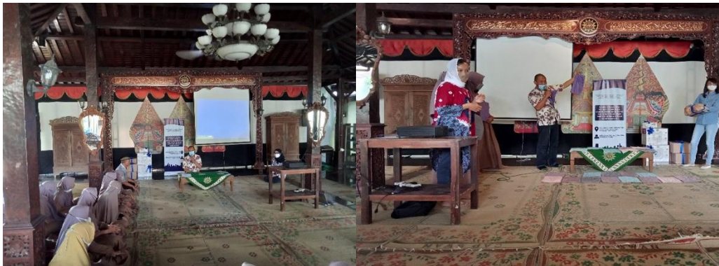
Gambar 1. Pemberian motivasi berwirausaha

Motivasi yang disampaikan seputar masalah pentingnya kesadaran finansial dimulai sejak dini sebagaimana disajikan pada Gambar 1 . Juga terkait definisi berwirausaha dan bagaimana seorang anak bisa memulai berwirausaha. Kegigihan mental wirausaha dan sifat pantang menyerah serta mau mencoba segala hal juga dipaparkan dengan baik oleh pemateri. Pemateri juga secara aktif memberikan pertanyaan dan meminta feedback dari peserta pelatihan untuk memastikan tujuan utama pemaparan materi tersampaikan.