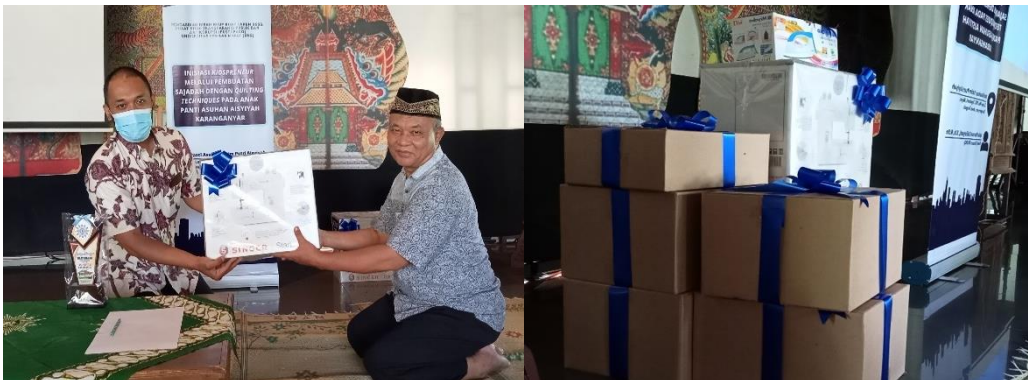
Gambar 3. Pemberian bantuan mesin jahit dan alat pendamping jahit lainnya

Tahap pengabdian ketiga yakni pemberian bantuan. Kegiatan ketiga dalam rumusan solusi “ Kidspreneur ” adalah pemberian bantuan. Bantuan berupa mesin jahit portabel, alat-alat jahit serta bantuan modal menjahit dengan teknik Quilting diberikan kepada pihak mitra. Hal ini dalam rangka menjaga keberlanjutan pengabdian agar skill menjahit anak-anak tetap terasah meskipun tim sudah tidak dapat mendampingi secara langsung pada Gambar 3.