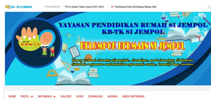
Gambar 1. Halaman awal rancangan website

Keterlibatan mitra dalam setiap tahapan perancangan website ini sangat diperlukan. Hal ini dilakukan agar hasil akhir dari website yang dirancang dapat sesuai dengan kebutuhan mitra. Adapun hasil akhir dari proses pengembangan ini adalah website yang mampu memberikan kemudahan bagi pihak KB-TK Si Jempol dalam hal memberikan informasi kepada masyarakat, khususnya terkait dengan kegiatan yang dilakukan oleh KB-TK Si Jempol Kota Tarakan. Adapun tampilan halaman awal dari website yang telah dirancang dapat dilihat pada Gambar 1 .