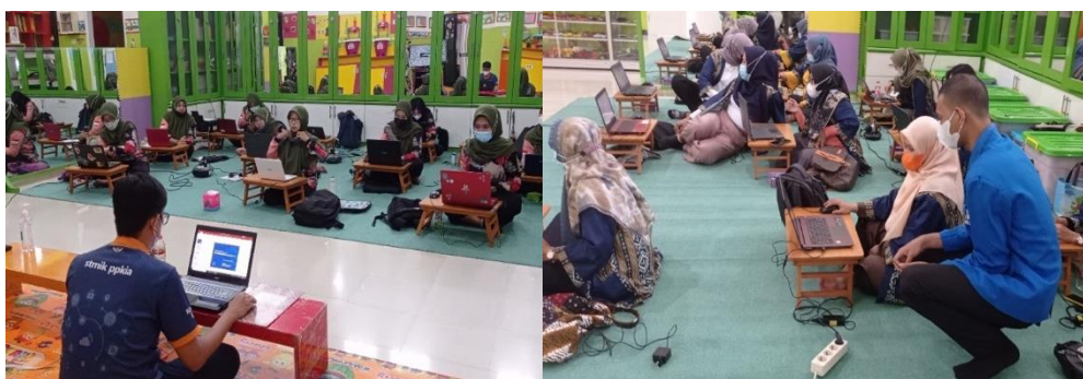
Gambar 3. Kegiatan pendampingan

Proses pendampingan pemanfaatan website bertujuan untuk mengenalkan dan memberikan pemahaman terkait dengan penggunaan website profile yang telah dirancang sebelumnya. Proses ini melibatkan keikutsertaan 12 orang dari pihak mitra yang terdiri dari staf hingga tenaga pendidik di KB-TK Si Jempol. Materi yang diberikan selama kegiatan pendampingan terkait tata cara penggunaan website , mulai dari manajemen user hingga cara mengunggah sebuah berita atau konten ke dalam website tersebut. Beberapa dokumentasi kegiatan pendampingan ini dapat dilihat pada Gambar 3 .