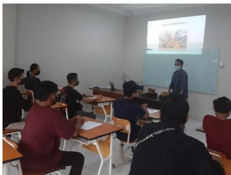
Gambar 1. Pemberian materi teori perawatan unit alat berat