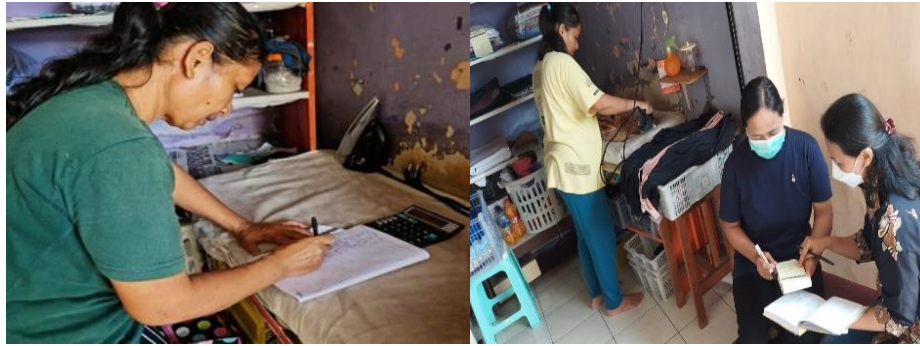
Gambar 2. Pendampingan dalam membuat pembukuan sederhana