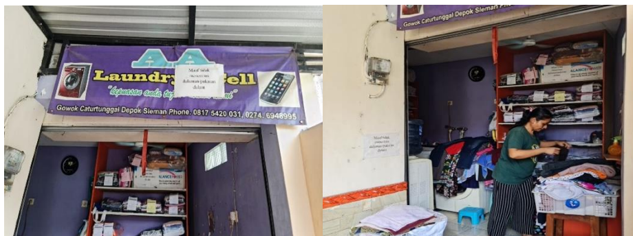
Gambar 1. Suasana usaha AA Laundry

Pendampingan pembukuan sederhana ini dilakukan di usaha AA Laundry karena telah diidentifikasi masalah mitra. Dari komunikasi yang terjadi dengan mitra pengabdian ditemukan permasalahan bahwa usaha AA Laundry kurang dapat mengatur dan mengelola keuangan usaha. Kurang pemahannya dalam pengelolaan keuangan dan pembukuan usaha ini terjadi karena beberapa faktor, diantaranya kurangnya pemahaman pemilik akan pentingnya pemisahan dana pribadi dan dana untuk usaha, serta ketidakpahaman dalam pembuatan pembukuan sederhana. Adapun suasana usaha AA laundry seperti terlihat pada Gambar 1 .