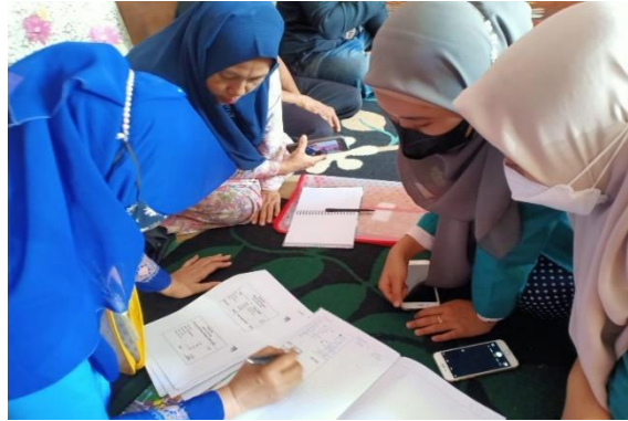
Gambar 2 . Pendampingan pembuatan laporan keuangan

Kegiatan dilanjutkan dengan praktik pencatatan transaksi pada buku kas, penjualan dan pembelian sampai pada membuat laporan keuangan sederhana yang didampingi oleh 2 mahasiswi jurusan Akuntansi Fakultas Ekonomi dan Bisnis Universitas Islam Malang yang terlihat pada Gambar 2 .