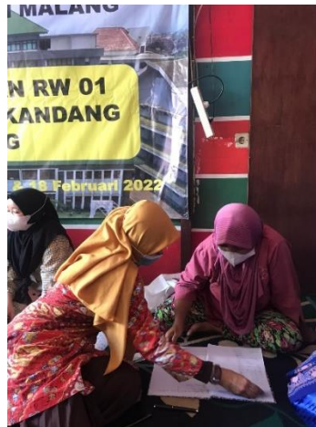
Gambar 3. Kegiatan evaluasi dan monitoring

Hasil evaluasi menunjukkan bahwa ada mitra yang telah berhasil meningkatkan kemampuan untuk mencatat transaksi usahanya serta membuat laporan keuangan sederhana secara mandiri yang ditunjukkan pada buku pembukuan yang telah dibuat selama 1 minggu terakhir. Namun ada juga mitra yang masih perlu dibimbing dalam mencatat transaksi dan membuat laporan keuangan sederhana secara mandiri karena masih membuat laporan seperti pada Gambar 4.