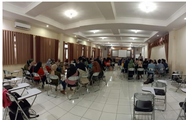
Gambar 1. Pelatihan P-Care

Pelatihan yang dilakukan oleh Unimma di Kampus 2 Gedung Fikes lantai 2. Pelatihan dan pembekalan ini bertujuan agar tim vaksinator lebih siap terjun langsung ke lapangan pada saat melakukan kegiatan vaksinasi. Pelatihan dan pembekalan yang diberikan yaitu cara menggunakan aplikasi P-Care untuk kegiatan vaksinasi bagian penginput data. Pelatihan P-Care seperti yang terlihat di Gambar 1 dimulai dari cara Log in website P-Care BPJS dan memasukkan username dan password . Kemudian masuk ke dalam pendaftaran tiket untuk mendaftarkan tiket untuk sasaran baru pertama kali melakukan vaksin dengan memasukkan NIK. Setelah mendaftarkan tiket, langsung ke proses screening , yaitu memasukkan suhu, tensi, jenis vaksin, no batch , dan dosis. Proses terakhir yaitu monitoring atau pengecekan apakah data sudah benar dan melakukan pencetakan kartu vaksin dengan cara di print .