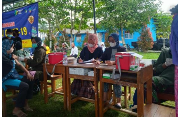
Gambar 2. Pelaksanaan kegiatan admin vaksinasi