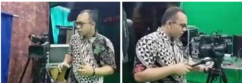
Gambar 5. Penjelasan tentang kamera dan cara mengoperasikan kamera

Adapun tahap pasca produksi terdiri dari (1) recording (via Zoom, Google Meet, OBS, Vmix, dan sebagainya), (2) streaming (via Youtube, Ms Stream, Instagram, dll), dan (3) editing (Adobe Premiere, Corel Video Studio, Finalcut, Vegas, Filmora, Pinnacle). Peserta pelatihan juga ditunjukkan praktik penggunaan alat di laboratorium agar dapat melihat bagaimana menggunakan kamera dan mengoperasikan dengan baik (Gambar 5).