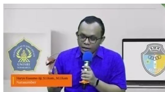
Gambar 3. Pembicara Videografi