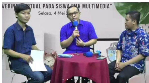
Gambar 1. Suasana pelatihan penyelenggaraan webinar

Kegiatan pelatihan videografi dan webinar pada sekolah multimedia di Kota Surakarta ini dilakukan pada bulan Mei 2021 yang dilaksanakan secara virtual , dimana pembicara akan memaparkan beberapa pokok bahasan terkait public speaking dan juga teknis penggunaan alat multimedia untuk persiapan webinar (Gambar 1).