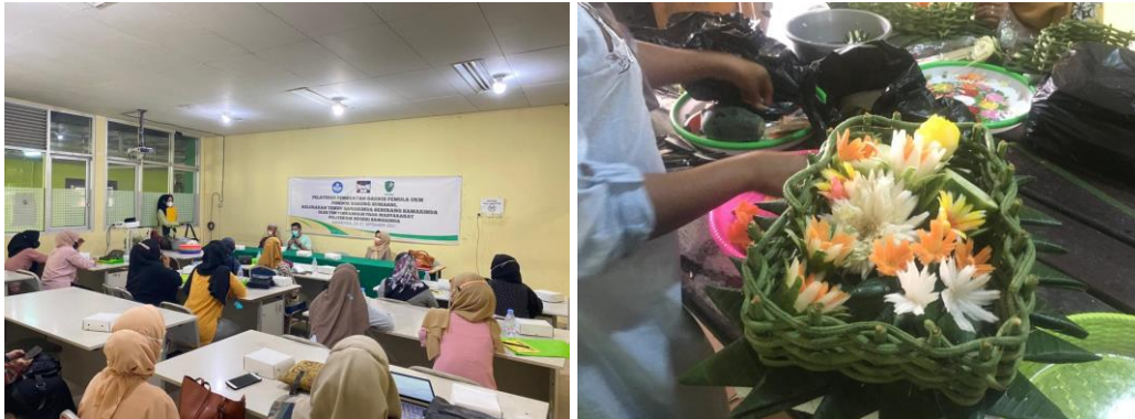
Gambar 1. Pelaksanaan pelatihan garnish

Pada tahap pelaksanaan ini, melakukan pelatihan, diskusi, praktik langsung, menugaskan peserta untuk membuat hiasan makanan berbahan dasar sayur dan akan dinilai oleh instruktur melalui hasil dari praktik. Pelaksanaan kegiatan dapat dilihat pada Gambar 1.