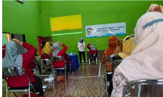
Gambar 2 . Kegiatan pertemuan kedua

Sedangkan, pada pertemuan kedua ialah sebanyak 9 orang kader. Pada pertemuan kedua peserta yang hadir tidak cukup banyak dikarenakan beberapa kader harus mengikuti kegiatan lain di waktu yang bersamaan. Dokumentasi pertemuan kedua ditunjukkan pada Gambar 2 .