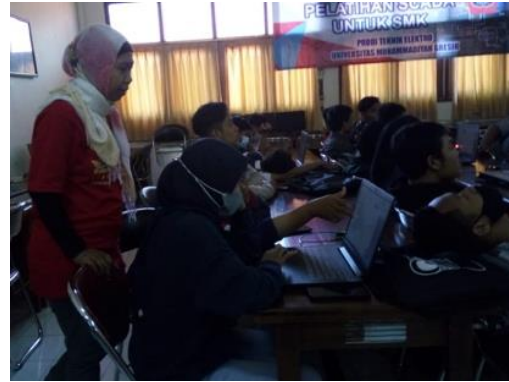
Gambar 4. Praktik Rangkaian Dasar PLC