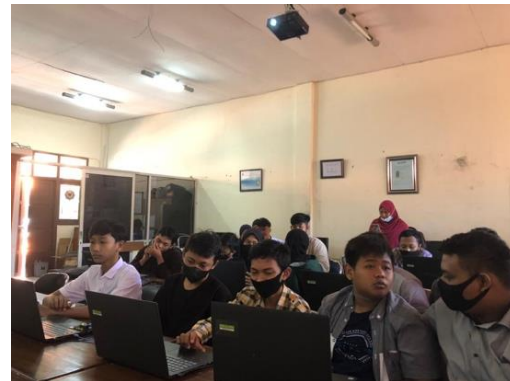
Gambar 6. Proses Penyelesaian Studi Kasus

Setelah melakukan workshop , untuk peningkatan kegiatan, diberikan kuesioner ke peserta pelatihan. Selain itu dari hasil kuesioner dapat diketahui pemahaman siswa SMK terhadap materi yang diberikan. Terdapat lima kategori penilaian, yaitu kurang sekali dengan dinilai "1", kurang dinilai "2", cukup dinilai "3", baik dinilai "4" dan baik sekali dinilai "5". Beberapa pertanyaan penilaian dalam kuesioner tentang :