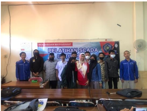
Gambar 1. Sesi Foto Bersama siswa SMK

Pelatihan SCADA telah berhasil dilaksanakan dengan sukses dimana terlihat dari kuesioner yang diberikan kepada para siswa setelah pelatihan selesai. Hasil kuesioner menunjukkan siswa-siswa merasa mendapatkan tambahan ilmu pengetahuan yang belum pernah mereka dapatkan di sekolah. Mereka juga menginginkan untuk diadakan pelatihan lanjutan agar mereka dapat menguasai teknologi SCADA yang ada secara lengkap. Gambar 1 dan Gambar 2 menunjukkan sesi foto bersama peserta dan mahasiswa yang terlibat dalam pelatihan ini.