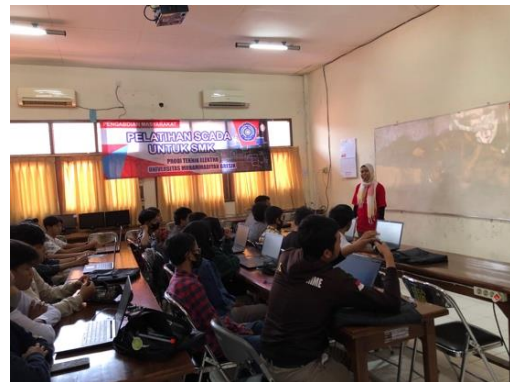
Gambar 2. Materi Pengenalan SCADA

Pelatihan ini dilaksanakan bersama tim dan mahasiswa agar siswa-siswa yang mengalami kesulitan dapat langsung ditangani sehingga tidak tertinggal dalam menjalankan langkah-langkah yang telah disusun. Gambar 3-6 adalah saat penjelasan materi dan proses pelatihan.