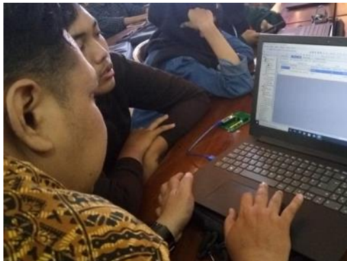
Gambar 5. Proses Pelatihan SCADA