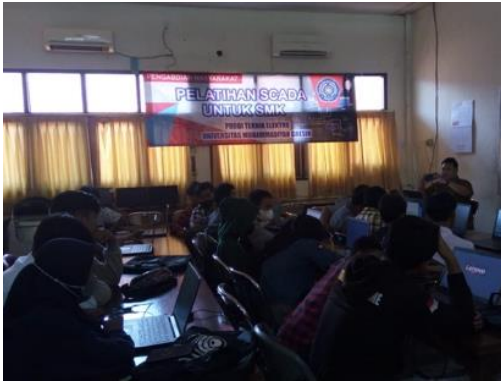
Gambar 3. Materi Teknis SCADA