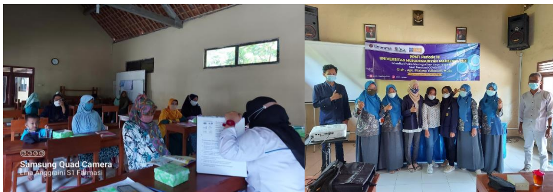
Gambar 3. Kegiatan kelas ibu hamil

Kegiatan kegiatan berupa edukasi kesehatan. Kegiatan edukasi kesehatan yang pertama adalah kelas bagi ibu hamil. Kegiatan ini dikemas dalam bentuk sosialisasi kesehatan terkait makanan yang dikonsumsi selama hamil, kondisi janin dalam posisi bayi sungsang, dan hal apa saja yang tidak diperkenankan untuk dilakukan ibu hamil ( Gambar 3 ). Kegiatan ini sejalan dengan Rahmi et al. (2020) yang melakukan asuhan kesehatan bagi ibu dan anak serta edukasi terkait kewaspadaan masyarakat agar tidak terjadi ledakan penduduk saat pandemi COVID-19 .