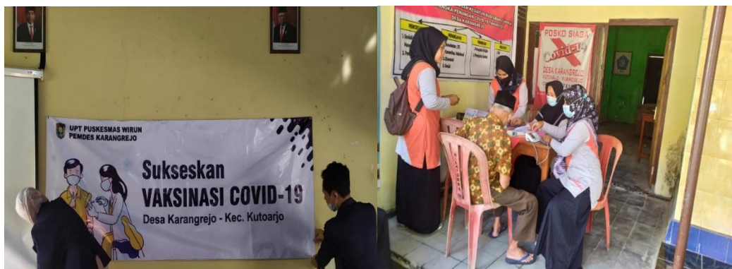
Gambar 1. Kegiatan vaksinasi

Kegiatan PPMT yang dilakukan pertama kali yaitu penyelenggaraan kegiatan vaksinasi dosis dua bagi lansia. Kegiatan ini merupakan kegiatan yang telah menjadi agenda kegiatan di Desa Karangrejo sebagai salah satu program peningkatan taraf kesehatan masyarakat yang bekerja sama dengan Puskesmas setempat. Kegiatan tersebut dilaksanakan pada Rabu, 16 Juni 2021 di Kantor Kepala Desa Karangrejo ( Gambar 1 ). Sebelum vaksinasi, dilakukan pengecekan kesehatan yang berupa pengecekan suhu dan tekanan darah.