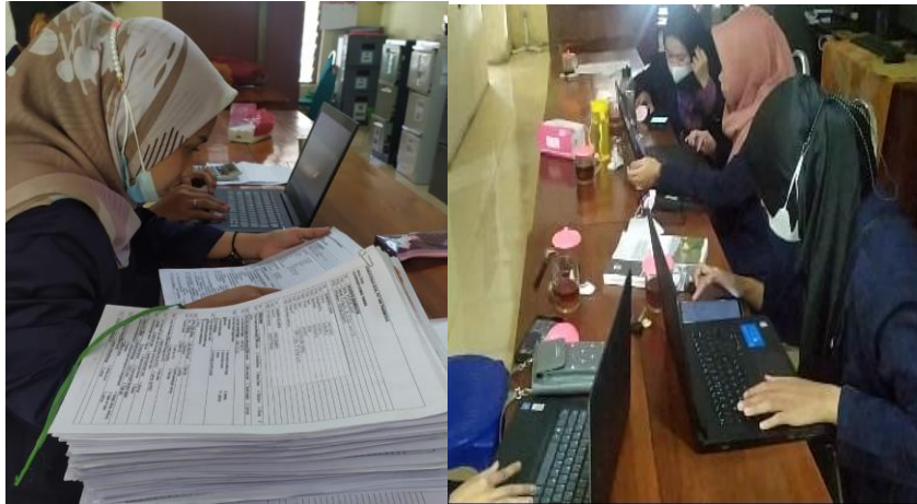
Gambar 2. Pendataan rumah sehat

Desa. Kegiatan ini dilakukan dengan pengisian kuesioner kepada setiap rumah warga dengan tujuan mengetahui banyaknya rumah tangga yang sudah tergolong dalam kategori rumah sehat di masa pandemi Covid-19. Kegiatan ini dilaksanakan pada Selasa 22 Juni 2021 di Kantor Desa Karangrejo ( Gambar 2 ).