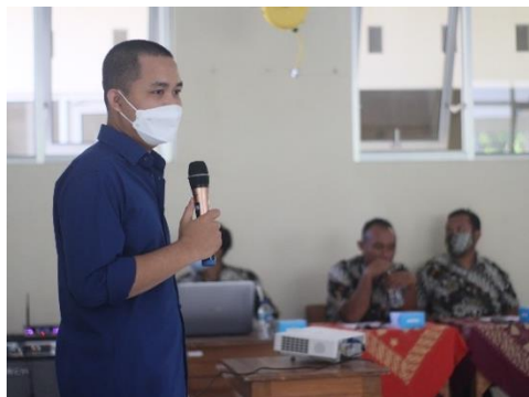
Gambar 3. Penyampaian Materi 1

Materi pertama yang disampaikan adalah terkait ketidakjujuran akademik dan bentuk-bentuk ketidakjujuran yang bisa dilakukan para siswa (Gambar 3).