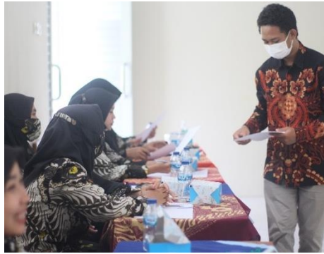
Gambar 5. Praktik Tools.