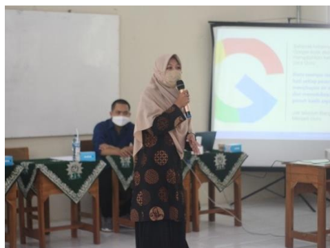
Gambar 4. Penyampaian Materi 2

Pada sesi materi kedua, diperkenalkan tools untuk mengidentifikasi ketidakjujuran akademik, baik secara self-inventory, observasi, dan penggunaan teknologi dalam mengetahui plagiarisme (Gambar 4).