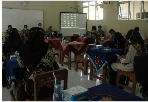
Gambar 2. Persiapan pelatihan