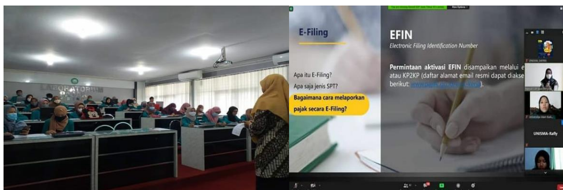
Gambar 2. Pelaksanaan diklat melalui daring dan luring

Diklat ini dilaksanakan dalam 2 (dua) model, yakni daring dan luring, seperti terlihat pada Gambar 2 . Untuk materi teoritis, dilakukan secara daring. Sedangkan untuk materi praktik, dilakukan secara luring. Dari 60 mahasiswa yang telah mengikuti diklat, dibagi menjadi 2 (dua) kelompok, masing-masing kelompok beranggotakan 30 orang dengan komposisi seimbang antara petugas registrasi, petugas asistensi, petugas pendukung, dan petugas pengawas. Dua kelompok ini ditugaskan di dua tempat yang berbeda, yaitu Kantor Pelayanan Pajak Pratama Batu (KPP Batu), dan Tax Center Fakultas Ekonomi Dan Bisnis Universitas Islam Malang. Pemilihan dua lokasi penugasan ini adalah hasil dari koordinasi Tax Center dengan Kanwil DJP Jatim III, tentunya dengan memperhatikan kebutuhan di wilayah kerja Kanwil DJP Jatim III. Penugasan berlangsung selama 5 (lima) minggu, dimulai dari minggu ke empat bulan Februari 2021 sampai dengan bulan Maret 2021.