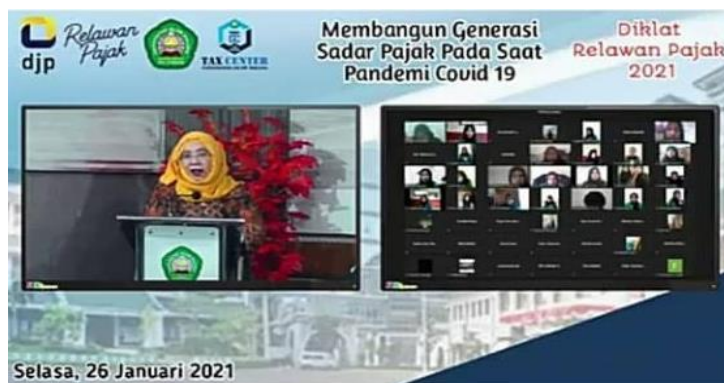
Gambar 1. Pembukaan diklat yang dilakukan secara daring