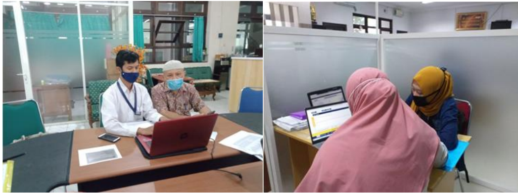
Gambar 3. Asistensi Pendampingan SPT WP OP

Tim TC Mengabdi bertugas sesuai dengan tugas dan fungsinya tentunya dengan didampingi oleh dosen pembimbing dan petugas KPP terkait. Kurang lebih ada 4.000 wajib pajak orang pribadi yang telah diasistensi oleh Tim TC Mengabdi. Sesuai dengan kode etik yang telah ditetapkan, tim TC Mengabdi melakukan asistensi dalam hal perhitungan pph terutang, penggunaan aplikasi e-Billing untuk penyetoran pajak dan pelaporan SPT dengan e-Filling.