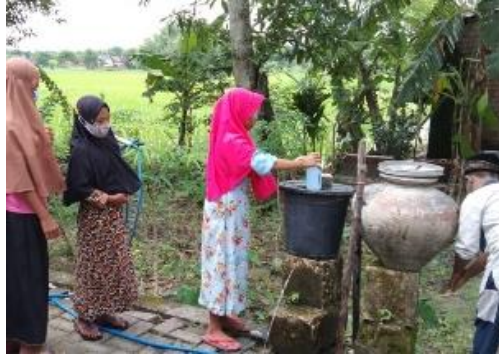
Gambar 3. Praktik cuci tangan 6 langkah menggunakan sabun dan air mengalir

(Sinaga et al., 2020) serta merupakan bagian dari upaya untuk menegakkan pilar hidup sehat dengan gemar mencuci tangan (Ibrahim et al., 2020).