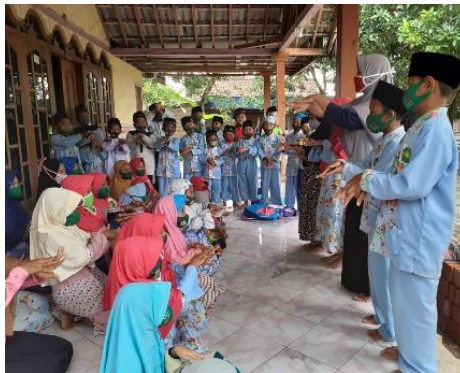
Gambar 2. Praktik cuci tangan 6 langkah bersama-sama

Tangan adalah bagian tubuh kita yang paling banyak tercemar kotoran dan bibit penyakit. Ketika memegang sesuatu, dan berjabat tangan, akan memungkinkan bibit penyakit mudah melekat pada kulit tangan. Telur cacing, virus, kuman, dan parasit yang mencemari tangan, akan menempel pada orang lain pada saat berjabat tangan atau bahkan saat makan dengan tangan yang tidak bersih, kotoran tertelan akan mengganggu pencernaan. Selain bertransmisi melalui tangan, kotoran, penyakit serta virus pada umumnya juga dapat melekat pada benda seperti gagang pintu, uang, alat-alat makan, maupun permainan. Saat benda dipegang dan kemudian tangan tidak dibersihkan maka akan sangat mungkin dapat tertular penyakit termasuk virus, sehingga mencuci tangan dengan benar dan sesuai sangatlah penting agar jenis virus dan penyakit tidak masuk ke dalam tubuh manusia (Suprpto et al., 2020) (Gambar 2).