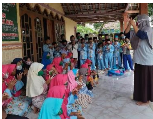
Gambar 1. Penyampaian materi dan demonstrasi cuci tangan 6 langkah

Kegiatan ini merupakan upaya dasar dalam memberikan pengetahuan sejak usia dini bahwa Covid -19 hingga saat ini masih merupakan permasalahan global dan belum berakhir ( Gambar 1 ). Semua orang harus waspada terhadap penyakit ini, sebab hingga saat ini masih adanya masyarakat yang terpapar oleh penyebaran virus ini. Virus ini dapat terpapar dengan mudah ke dari orang ke orang atau melalui suatu benda yang disentuh, maupun dari udara yang dihirup oleh sistem pernafasan. Untuk itu sangat penting melindungi diri yang dimulai dari diri sendiri, keluarga maupun lingkungan sekitar dengan patuh menerapkan protokol kesehatan seperti menghindari kerumunan, memakai masker, menjaga jarak dan mencuci tangan yang merupakan bagian dari PHBS (Perilaku Hidup Bersih dan Sehat). Mencuci tangan adalah tindakan dasar yang penting untuk melindungi kesehatan kita termasuk dari Covid-19 . Tanpa adanya wabah ini dalam keseharianpun wajib melakukan cuci tangan sewaktu-waktu jika merasa tangan kita kotor, terlebih saat hendak akan makan. Cuci tangan merupakan tindakan yang mudah dilakukan, namun cuci tangan yang benar sesuai anjuran WHO adalah cuci tangan 6 langkah dengan menggunakan sabun dan air mengalir. Untuk itu anak-anak penting untuk mengetahui manfaat cuci tangan maupun langkah-langkah cuci tangan yang benar, karena usia anak-anak merupakan kelompok yang rentan terpapar suatu penyakit seperti diare bahkan Covid-19 .