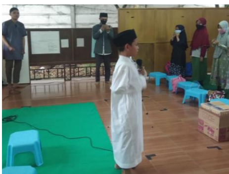
Gambar 2. Evaluasi santri

Dari hasil evaluasi yang dilakukan pada Gambar 2 dapat diketahui bahwa santri sudah mulai mengenal dan mampu membedakan antara murottal dan mujawwad . Kemudian santri juga sudah mampu mengenal salah satu ataupun beberapa nada yang telah diajarkan kepada mereka. Selain itu, santri terlihat sangat bersemangat dalam membaca Al-Quran. Terlihat dari semangatnya dan janji mereka untuk terus mengulangi apa yang sudah diajarkan.