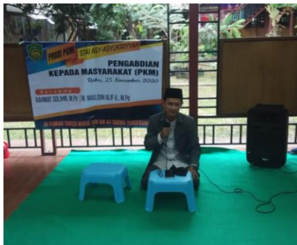
Gambar 1. Demonstrasi irama murottal dan mujawwad

Perlu digarisbawahi bahwa irama murottal dan mujawwad adalah salah satu seni membaca Al-Quran yang tidak dapat dikuasai secara instan. Perlu proses dan usaha yang tidak sedikit agar santri mampu mengimplementasikan irama ini dalam bacaan Al-Quran mereka secara luwes. Maka dari itu, pada pelatihan ini fokus utama pemateri adalah pengenalan terhadap irama murottal dan mujawwad kepada santri sehingga mereka termotivasi dan muncul keinginan untuk terus melanjutkan latihan mereka agar dapat menguasai irama ini dengan baik dan benar.