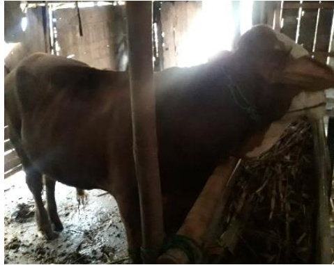
Gambar 9. Salah satu ternak sapi milik warga Desa Ngleses, Boyolali

dimanfaatkan secara maksimal untuk kepentingan ternak sapi yang memerlukan asupan bernutrisi tinggi. Gambar 9 menunjukkan salah satu ternak sapi yang dimiliki penduduk dari kelompok mitra 2.