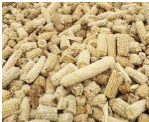
Gambar 3. Limbah tongkol jagung

Proses pengolahan tepung limbah tongkol jagung dilakukan menggunakan mesin penghancur hasil rekayasa UMY. Mesin penghancur ini dapat menghasilkan tepung limbah tongkol jagung yang cukup lembut yang dapat dikonsumsi oleh ternak. Dalam hal ini, sebenarnya tongkol jagung telah mengandung nutrisi yang cukup tinggi (Ako, 2013; Gustiani & Permadi, 2015; Wibawa, dkk., 2015). Akan tetapi, karena hasil pertanian penduduk Desa Ngleles juga menghasilkan padi, maka limbah sekam padi juga perlu dimanfaatkan untuk meningkatkan nutrisi pada formula makanan ternak.