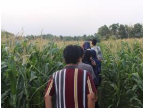
Gambar 1. Lahan pertanian jagung

Yogyakarta (UMY) telah dicoba untuk mengolah limbah tongkol jagung menjadi makanan ternak bernutrisi. Formula makanan ternak bernutrisi ini dibuat dengan komposisi 50% tepung limbah tongkol jagung, 45% dedak padi, dan 5% bahan tambahan terdiri dari limbah kulit kedelai, ampas singkong, dan garam.