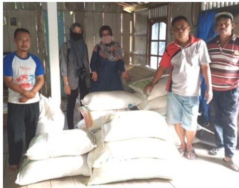
Gambar 10. Kunjungan Tim PKM UMY ke Desa Ngleses, Boyolali

Untuk mempercepat penambahan bobot sapi yang dimiliki oleh peternak sapi pada mitra 2, maka sebagai langkah awal konsumsi makanan ternak bernutrisi, diformulasikan dari bahan tepung komersial sembari mempersiapkan pembuatan tepung limbah tongkol jagung dan dedak padi.