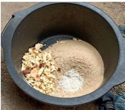
Gambar 7. Racikan satu paket formula makanan ternak bernutrisi