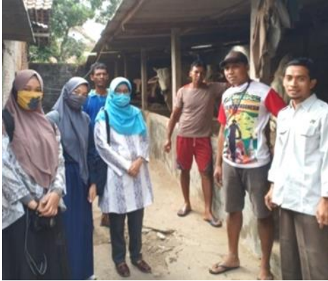
Gambar 5. Kunjungan Kelompok PKM UMY ke lokasi mitra 1