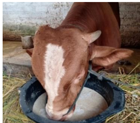
Gambar 8. Sapi yang sedang mengkonsumsi makanan bernutrisi

Makanan tersebut dikonsumsi dua kali sehari yang dilakukan sejak tanggal 11 Agustus 2020. Pengukuran lingkar dada sapi sebagai salah satu cara untuk memprediksi penambahan bobot sapi dilakukan selama sebulan yaitu hingga tanggal 11 September 2020. Hasil pengukuran dilakukan sekali dalam satu minggu. Hasil percobaan tersebut dirangkum pada Tabel 1 . Dari hasil percobaan yang ditunjukkan pada Tabel 1 tersebut menunjukkan keberhasilan formula makanan ternak bernutrisi berbasis tepung limbah tongkol jagung dengan indikator penambahan bobot sapi yang mencapai 35 kg dalam waktu satu bulan.