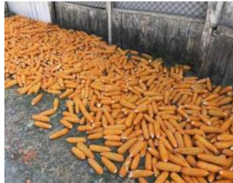
Gambar 2. Hasil panen jagung