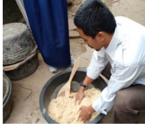
Gambar 6. Mempersiapkan formula makanan ternak