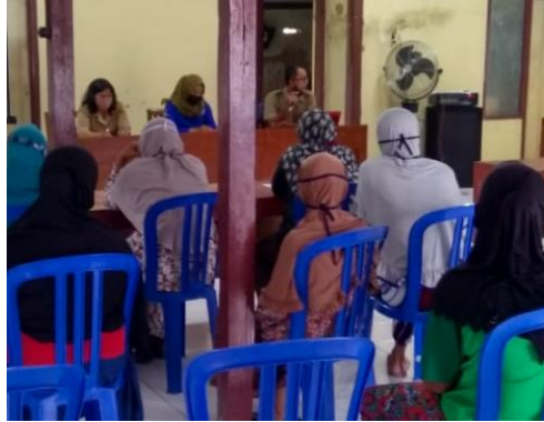
Gambar 4. Sosialisasi program P2WKSS