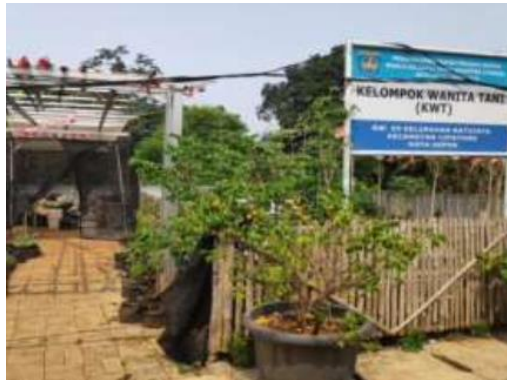
Gambar 2. Asesmen kebun kelompok wanita tani

Tahap ini dilakukan dengan mengidentifikasi masalah, yaitu kebutuhan yang dirasakan dan juga sumber daya yang dimiliki. Dalam proses ini dinas-dinas terkait melakukan survei terlebih dahulu. Melalui dinas-dinas terkait di tingkat kelurahan, dinas melakukan kordinasi untuk penetapan akan dilaksanakannya program P2WKSS. Tim membantu dalam upaya memetakan potensi sekaligus menyusun rencana program. Tahap selanjutnya dari kelurahan akan turun kebawah melalui RT dan RW untuk selanjutnya mengkaji dan melihat potensi SDM yang ada di masing-masing kelurahan.