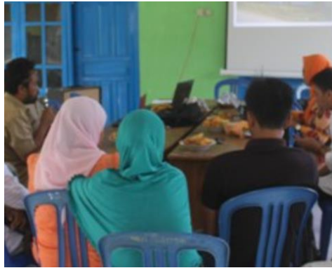
Gambar 3. Diskusi rencana program

Pada tahapan alternatif program ini dinas lebih memfokuskan apa saja yang menjadi usulan dan permintaan yang telah dibuat oleh pihak Kelurahan berdasarkan hasil survey dan asesmen kelurahan kepada kelompok binaan. Tentu saja hal ini pula tidak terlepas dari peran kader serta RT dan RW yang membantu pihak kelurahan dalam merencanakan alternatif-alternatif program bagi kelompok binaan. Berdasarkan hasil partisipasi juga menunjukkan adanya alternatif-alternatif program ini dirancang oleh stakeholder terkait yang menjadi lokus dari pelaksanaan program P2WKSS.