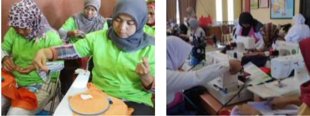
Gambar 5. Proses pelatihan

Meski demikian, berjalannya kegiatan-kegiatan pelatihan tersebut juga tidak terlepas dari hambatan yang di hadapi oleh kelompok binaan. Dalam pelaksanaan seperti pelatihan memasak dan membuat kue, alat-alat telah disediakan oleh pihak dinas sehingga dengan mudah dipraktikkan. Akan tetapi setelah selesainya pelaksanaan keterampilan yang diberikan, kelompok binaan tidak memiliki alat-alat yang disediakan dinas, sehingga mereka tidak dapat mempraktekkan dengan mudah. Untuk menyulam, ibu rumah prasejahtera kesulitan dalam memasarkan produk jika mereka sudah memproduksinya. Berbeda dengan pelatihan-pelatihan seperti merias, menjahit dan hantaran yang dapat dengan mudah dilakukan setelah kegiatan keterampilan diberikan. Untuk Kelompok Wanita Tani, ibu-ibu juga sudah dapat memanfaatkan fasilitas yang diberikan dinas seperti alat-alat pertanian dan bibit tanaman.