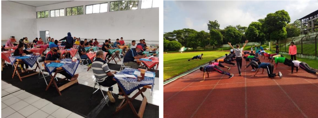
Gambar 3. Kegiatan pelatihan di kelas dan praktik

Pada Gambar 1 dan 2 dapat dilihat bahwa hampir seluruh peserta (89%) mengalami peningkatan pemahaman yang cukup signifikan. Hanya ada beberapa peserta yang tidak mengalami peningkatan. Adapun beberapa dokumentasi selama kegiatan pelatihan disajikan pada Gambar 3 berikut.