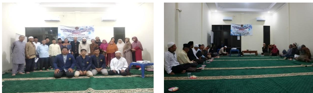
Gambar 3. Kegiatan penyuluhan bersama mitra Pimpinan Ranting Muhammadiyah (PRM) Kalinegoro, Kec. Mertoyudan, Kab. Magelang