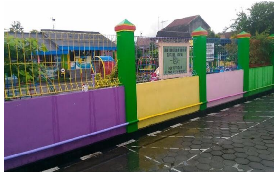
Gambar 2. Gedung Kegiatan Pendidikan yang dikelola Pimpinan Ranting Muhammadiyah (PRM) Kalinegoro, Kec. Mertoyudan, Kab. Magelang

Target luaran kegiatan pengabdian ini adalah semua pengurus Pimpinan Ranting Muhammadiyah (PRM) Kalinegoro, Kec. Mertoyudan, Kab. Magelang yakni dapat memahami seluk-beluk prosedur pendaftaran sertifikat tanah wakaf dengan baik,. Selain itu pengurus Pimpinan Ranting Muhammadiyah (PRM) Kalinegoro, Kec. Mertoyudan, Kab. Magelang dapat memanfaatkan tanah wakaf secara maksimal untuk kegiatan keagamaan, pendidikan, dan peningkatan kemakmuran sosial. Dengan adanya sertifikasi atas tanah wakaf, tanah wakaf yang dikelola Pimpinan Ranting Muhammadiyah (PRM) Kalinegoro, Kec. Mertoyudan, Kab. Magelang akan lebih terjamin keamanannya, tidak hilang, tidak dijual, dan tertib administrasi.