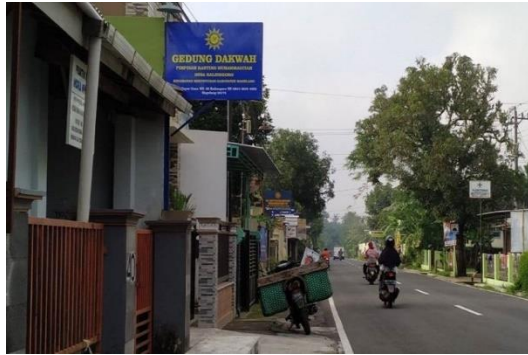
Gambar 1. Kantor sekaligus gedung serba guna Pimpinan Ranting Muhammadiyah (PRM) Kalinegoro, Kec. Mertoyudan, Kab. Magelang