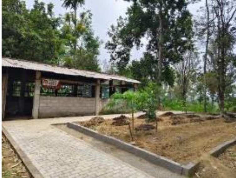
Gambar 12. Instalasi rumah biogas