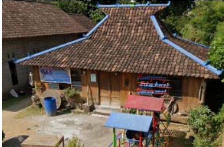
Gambar 4. Griya Kawruh

Kawruh ( Gambar 4 ) hanya berupa rumah dengan susunan yang tidak tertata bahkan banyak perabotan yang mulai usang dan berdebu.