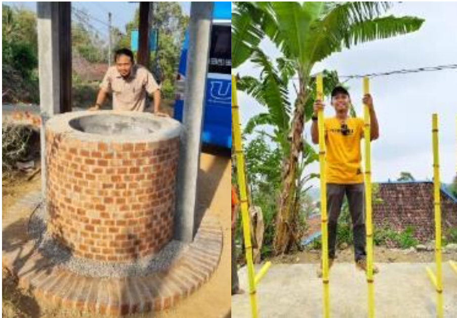
Gambar 13. Instalasi replika sumur dan egrang