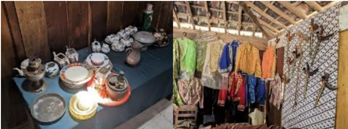
Gambar 3. Peralatan kuno dan baju adat jaman dahulu

Griya Kawruh merupakan sebuah museum kecil berisi peralatan kuno, seperti peralatan minum dari keramik dan miniatur dapur tradisional, yang berisikan benda-benda tempo dulu seperti perkakas, televisi, baju adat, senjata, mesin ketik, telepon dan lukisan kuno seperti terlihat pada Gambar 3.