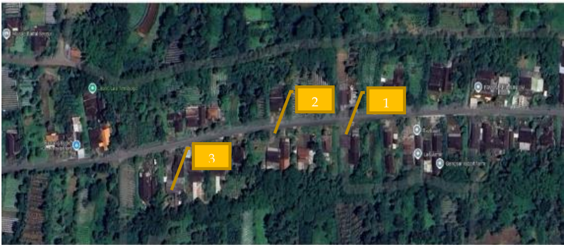
Gambar 1. Spot wisata Kampung Edukasi Duren Sari seperti Museum Griya Kawruh (1), Plataran Srawung (2) dan Rumah biogas (3)

Salah satu dusun yang berada di Desa Kembangkuning adalah Dusun Duren Sari (Prawesti et al., 2023), dimana telah berdiri spot wisata dengan nama Kampung Edukasi Duren Sari yang mengajak pengunjung untuk mengenal perabotan kuno yang telah usang ditelan kemajuan zaman di museum Griya Kawruh. Wisatawan juga bisa mempelajari sekaligus memiliki pengalaman langsung untuk praktek dolanan tempo dulu seperti egrang dan jaranan yang bisa ditemukan di lokasi Plataran Srawung. Guna menambah objek kunjungan wisata, maka Kampung Edukasi Duren Sari bekerja sama dengan Universitas Muhammadiyah Surakarta membangun 1 unit biogas sebagai upaya edukasi pengelolaan energi alternatif yang ramah lingkungan. Lokasi spot wisata di Kampung Edukasi Duren Sari bisa dilihat di Gambar 1.