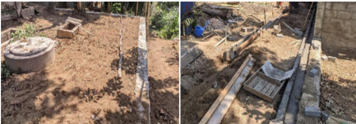
Gambar 11. Hasil pengawasan pengerjaan rumah biogas

Kegiatan pengawasan dilakukan dengan cara turun ke lapangan sebanyak dua kali yakni pada 3 Oktober 2024 dan 5 November 2024 ( Gambar 11 ). Tujuan dari pengawasan ini dalam rangka memastikan bahwa pengerjaan site plan yang ada sudah sesuai dengan desain yang disusun oleh tim. Misal, pada pengerjaan rumah biogas, tim melakukan pengecekan dan didapatkan hasil yakni: a) Pengerjaan galian timbunan dan pemasangan fondasi pada pengawasan minggu ke 4 sudah hampir selesai selanjutnya akan dilakukan pekerjaan pembersihan; b) Perkembangan pengerjaan fondasi sudah mencapai 90%; c) Jenis fondasi yang digunakan adalah fondasi batu kali; d) Finishing area biogas menggunakan area resapan rumput.