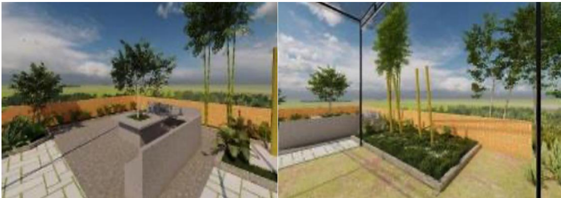
Gambar 8. Penataan taman dan replika egrang