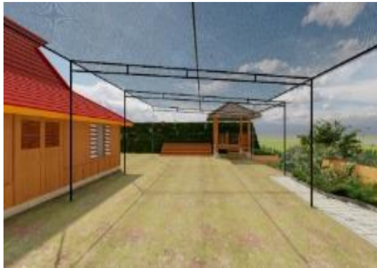
Gambar 7. Penataan gazebo dan tribun penonton

Penataan site plan pada lokasi Plataran Srawung mulai dari penambahan tribun dan pemindahan gazebo (Gambar 7), juga penambahan taman sebagai spot foto dengan background pemandangan, di samping itu juga terdapat replika permainan tradisional yang semula merupakan alat egrang dari bambu, ditambah dengan replika egrang dari beton yang dapat dengan mudah diakses oleh wisatawan (Gambar 8).