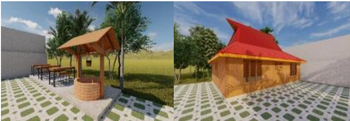
Gambar 5. Desain site plan Griya Kawruh

Setelah dilakukan penataan site plan pada Griya Kawruh pengunjung akan dapat dengan mudah mengakses barang-barang kuno yang ada di dalam Griya Kawruh sesuai dengan penggolongannya dan benar-benar seperti masuk ke rumah dengan tempo dulu klasik dan tradisional. Penataan juga dilakukan di halaman Griya Kawruh agar wisatawan semakin nyaman dengan fasilitas yang disediakan berupa replika sumur, tempat duduk dan pemasangan paving blok di halaman sebagaimana terlihat pada Gambar 5 .