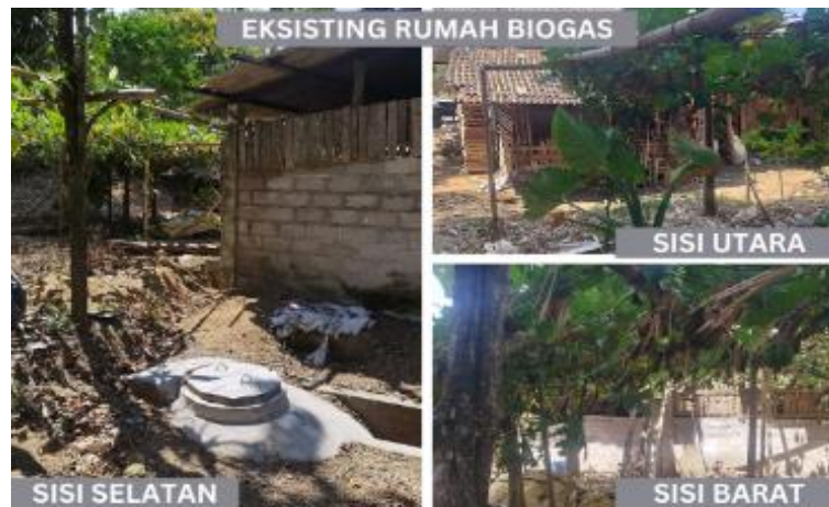
Gambar 9. Kondisi eksisting rumah biogas

Rumah Biogas yang berada merupakan spot wisata yang dijadikan salah satu tempat edukasi oleh pengunjung, karena keunikan dan kreativitas dari warga sekitar yang memanfaatkan limbah kotoran sapi sebagai sumber energi terbarukan seperti biogas (Shitophyta et al., 2022). Biogas yang dimanfaatkan oleh masyarakat desa sebagai pengganti bahan bakar kompor gas konvensional (Ginting et al., 2020; Satpathy et al., 2022; Yang et al., 2012).