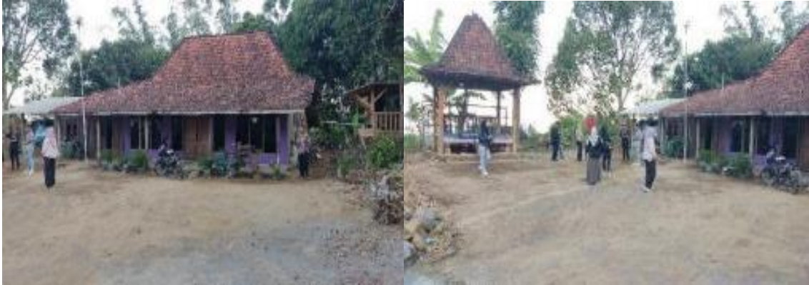
Gambar 6. Plataran Srawung lama

Penataan site plan pada lokasi Plataran Srawung mulai dari penambahan tribun dan pemindahan gazebo (Gambar 7), juga penambahan taman sebagai spot foto dengan background pemandangan, di samping itu juga terdapat replika permainan tradisional yang semula merupakan alat egrang dari bambu, ditambah dengan replika egrang dari beton yang dapat dengan mudah diakses oleh wisatawan (Gambar 8).