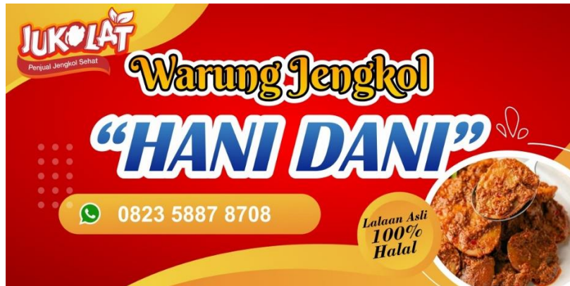
Gambar 4. Hasil desain peserta pelatihan aplikasi Canva

dan setelah diberikan pelatihan, mitra berkategori baik menjadi 89%. Sedangkan terkait pemanfaatan media sosial dan aplikasi Canva sebelum diberikan implementasi berupa pelatihan mitra berkategori baik sebesar 6% setelahnya menjadi 83%, sehingga dalam hal ini rerata persentase pengetahuan yang berkategori baik sebesar 83%.