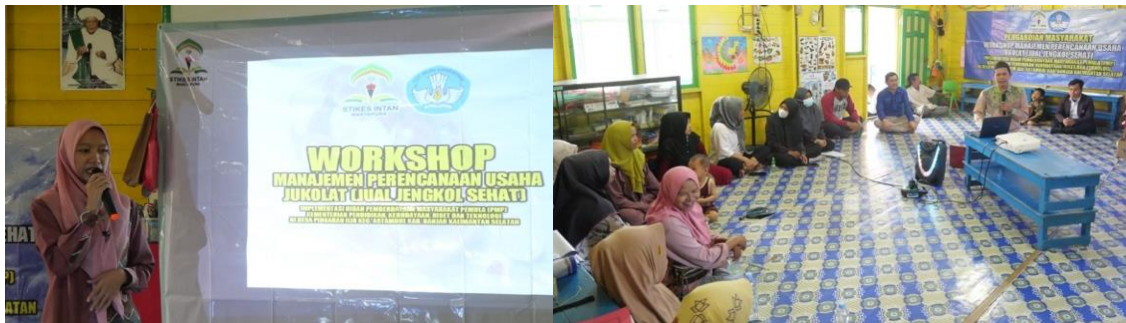
Gambar 1. Kegiatan pelatihan manajemen wirausaha