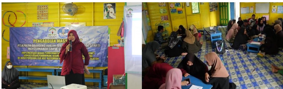
Gambar 3. Kegiatan pelatihan pemanfaatan media sosial dan aplikasi Canva

Kegiatan ketiga adalah terkait dengan pelatihan pemanfaatan media sosial dan aplikasi Canva. Pelatihan yang dilakukan pada Gambar 3 bertujuan membekali peserta dengan keterampilan praktis dalam memanfaatkan media sosial (WhatsApp, Facebook, Instagram, TikTok) serta aplikasi Canva untuk mendukung promosi produk jukolat. Melalui kegiatan ini, peserta diajarkan secara langsung cara membuat konten menarik, mengelola akun media sosial, dan mendesain grafis yang menarik menggunakan Canva. Salah satu hasil desain peserta pelatihan tersaji pada Gambar 4 .