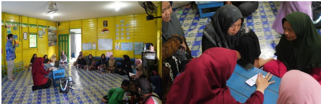
Gambar 2. Kegiatan pelatihan branding dan digital marketing

Kegiatan ketiga adalah terkait dengan pelatihan pemanfaatan media sosial dan aplikasi Canva. Pelatihan yang dilakukan pada Gambar 3 bertujuan membekali peserta dengan keterampilan praktis dalam memanfaatkan media sosial (WhatsApp, Facebook, Instagram, TikTok) serta aplikasi Canva untuk mendukung promosi produk jukolat. Melalui kegiatan ini, peserta diajarkan secara langsung cara membuat konten menarik, mengelola akun media sosial, dan mendesain grafis yang menarik menggunakan Canva. Salah satu hasil desain peserta pelatihan tersaji pada Gambar 4 .