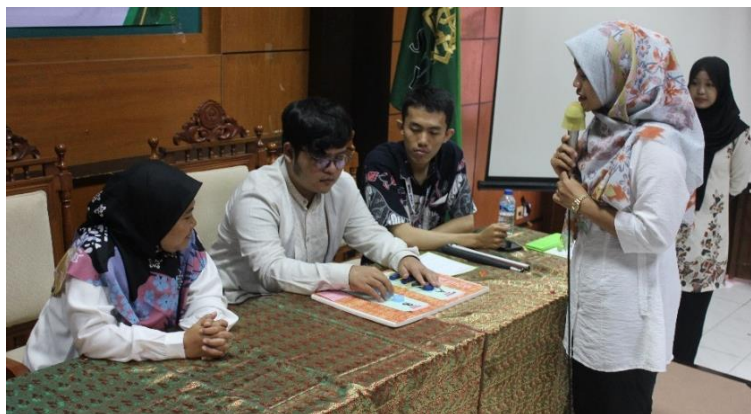
Gambar 5. Uji coba media melalui praktik mengajar

Setelah seluruh peserta menyelesaikan pengembangan media pembelajaran selanjutnya dilakukan uji coba media. Dalam uji coba dihadirkan satu siswa kelas VI. Setiap kelompok menjelaskan materi kepada siswa tersebut melalui praktik mengajar dalam waktu 10 menit ( Gambar 5 ). Selanjutnya media hasil pengembangan akan diberikan masukan oleh mahasiswa VI dan pameri kegiatan. Praktik mengajar bertujuan untuk memastikan bahwa media pembelajaran yang dikembangkan dapat diimplementasikan. Selain itu praktik mengajar juga dapat digunakan untuk melihat apakah kemampuan yang dimiliki terapkan dengan baik ( Rhamayanti, 2018 ). Seluruh peserta sangat antusias mengikuti sesi ini. Bu Heni mengungkapkan “ Saya sangat bersyukur dan senang dapat mengikuti kegiatan ini, dapat memiliki pengalaman langsung mengajar matematika menggunakan media pembelajaran untuk siswa VI. Ada kebahagiaan yang luar biasa saat siswa yang mencoba media bisa memahami materi yang saya berikan. ”