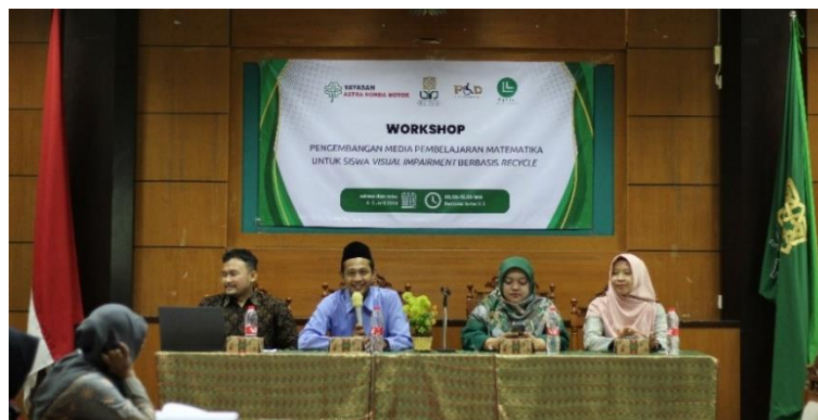
Gambar 1. Pembukaan kegiatan

Kegiatan pengabdian dilaksanakan pada 4 sampai 5 Juni 2024. Hari pertama kegiatan dimulai pukul 08.00 WIB dengan dihadiri oleh 36 guru matematika SMP Kabupaten Sleman. Pembukaan acara dilaksanakan pukul 08.30 dihadiri oleh ketua Pusat Layanan Difabel (PLD) UIN Sunan Kalijaga Yogyakarta dan Ketua Badan Kerjasama Sekolah (BKS) Muhammadiyah Kabupaten Sleman (Gambar 1). Setelah pembukaan seluruh peserta menyelesaikan pre-test guna mengukur pemahaman mereka terkait media pembelajaran matematika untuk siswa VI.