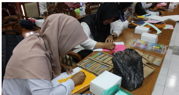
Gambar 4. Workshop pengembangan media pembelajaran

Kegiatan hari pertama dilanjutkan dengan focus group discussion (FGD) untuk merancang media pembelajaran yang akan dikembangkan. Dalam FGD disepakati pengembangan media dilakukan berkelompok dengan anggota dua guru setiap kelompoknya. Dalam FGD juga ditentukan 18 media yang akan dikembangkan pada hari kedua beserta kebutuhan alat dan bahan untuk pengembangannya. Setelah FGD selesai, kegiatan hari pertama diakhiri pada pukul 14.00 WIB. Kegiatan hari kedua dilaksanakan pada tanggal 5 Juni 2024 dimulai pukul 08.00 WIB. Seluruh peserta melakukan praktik langsung pengembangan media pembelajaran matematika untuk siswa VI berbasis recycle sampai pukul 10.30 WIB (Gambar 4). Seluruh anggota tim melakukan pendampingan untuk memastikan media dapat dikembangkan dengan baik. Bahan yang digunakan dalam pengembangan media diantaranya styrofoam, karton, papan kayu, kertas, tutup botol, dan lain-lain. Beberapa alat yang digunakan dalam pengembangan diantaranya cutter, gunting, lem, reglet, dan solder.