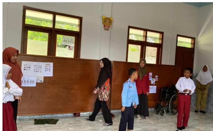
Gambar 2. Pendampingan latihan menari dan fashion show

Setelah melakukan upacara, para siswa bergegas masuk ke dalam kelas masing-masing untuk melakukan kegiatan belajar mengajar, namun sebelum kegiatan belajar mengajar dimulai para siswa selalu dibiasakan untuk berdoa terlebih dahulu serta membaca asmaul husna dan sholawat nabi . Setelah itu dilanjutkan dengan kegiatan belajar mengajar yang dilakukan oleh para guru serta didampingi oleh anggota Kelompok 36 KKN-P. Kegiatan dilanjutkan dengan pendampingan latihan menari dan fashion show untuk acara yang akan dilakukan oleh para siswa yang disajikan pada Gambar 2.