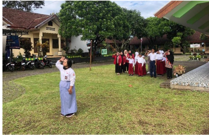
Gambar 1. Upacara bendera di SLB Kirana Hati Bunda Desa Tamiajeng

Setelah melakukan upacara, para siswa bergegas masuk ke dalam kelas masing-masing untuk melakukan kegiatan belajar mengajar, namun sebelum kegiatan belajar mengajar dimulai para siswa selalu dibiasakan untuk berdoa terlebih dahulu serta membaca asmaul husna dan sholawat nabi . Setelah itu dilanjutkan dengan kegiatan belajar mengajar yang dilakukan oleh para guru serta didampingi oleh anggota Kelompok 36 KKN-P. Kegiatan dilanjutkan dengan pendampingan latihan menari dan fashion show untuk acara yang akan dilakukan oleh para siswa yang disajikan pada Gambar 2.