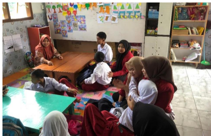
Gambar 3. Pendampingan pembelajaran SLB Kirana Hati Bunda Desa Tamiajeng