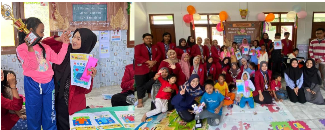
Gambar 4. Lomba mewarnai dan pemberian hadiah

Tidak hanya itu, Kelompok 36 KKN-P juga melakukan pendampingan pada berbagai macam kegiatan yang dilakukan pada hari ke empat pengabdian, yang salah satunya yaitu membantu persiapan pelaksanaan fashion show , tim pengabdian membantu untuk merias para siswi. Dilanjutkan dengan hari selanjutnya yaitu diadakan perlombaan mewarnai, hal ini bertujuan untuk memberikan pengalaman baru bagi siswa. Tim pengabdian memberikan apresiasi dengan memberikan hadiah kepada seluruh siswa yang mengikuti perlombaan, penyerahan apresiasi disajikan pada Gambar 4 . Kegiatan ini dilaksanakan dengan tujuan untuk meningkatkan keterampilan serta dapat menjadi kegiatan yang dapat digunakan untuk menggali potensi para siswa.