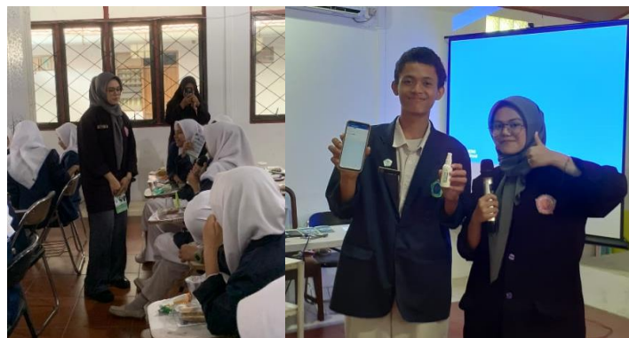
Gambar 3. Sesi tanya jawab dan pengecekan registrasi kosmetika menggunakan aplikasi BPOM mobile

Kegiatan pengabdian kepada masyarakat melalui program RKTL ini diakhiri dengan pemberian doorprize dan cinderamata kepada siswa dan Kepala Sekolah SMK Rise