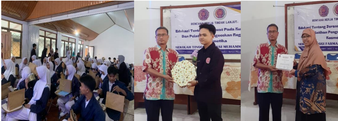
Gambar 4. Dokumentasi penyerahan doorprize dan cinderamata

Kedawung (Gambar 4). Secara keseluruhan kegiatan ini berjalan dengan aman, tertib dan lancar.