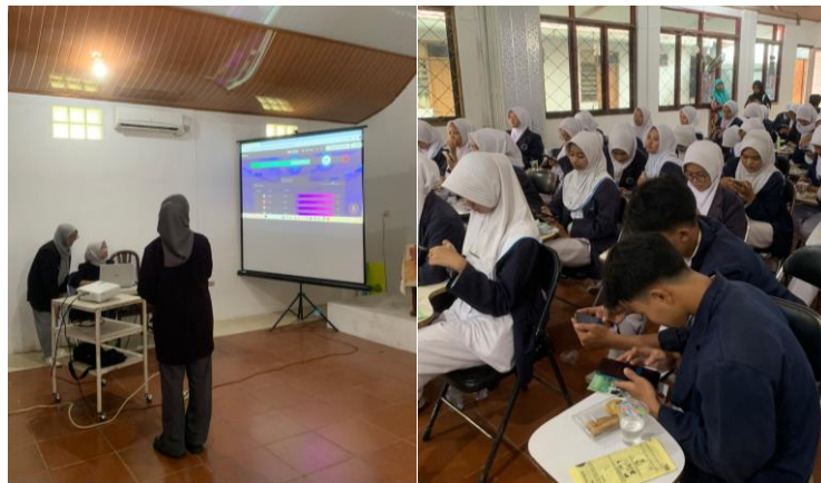
Gambar 5. Respons peserta menjawab pre-test dan post-test setelah pemaparan materi

Kegiatan pre-test dan post-test dilakukan menggunakan program Quizizz. Pre-test dilakukan sebelum penyampaian materi dan post-test dilakukan setelah materi tentang jerawat diberikan. Hal ini dimaksudkan untuk evaluasi dan mengukur sejauh mana pemahaman materi dapat diterima oleh peserta (Gambar 5). Dari kegiatan pre-test dan post-test ini para siswa mengalami peningkatan pengetahuan tentang jerawat dan penanganannya serta pengecekan registrasi kosmetika melalui aplikasi BPOM Mobile. Hasil pre-test dan post-test menunjukkan terjadinya peningkatan pemahaman peserta terkait jerawat, obat jerawat dan pengecekan registrasi kosmetik dari 87% menjadi 96% (Gambar 6).