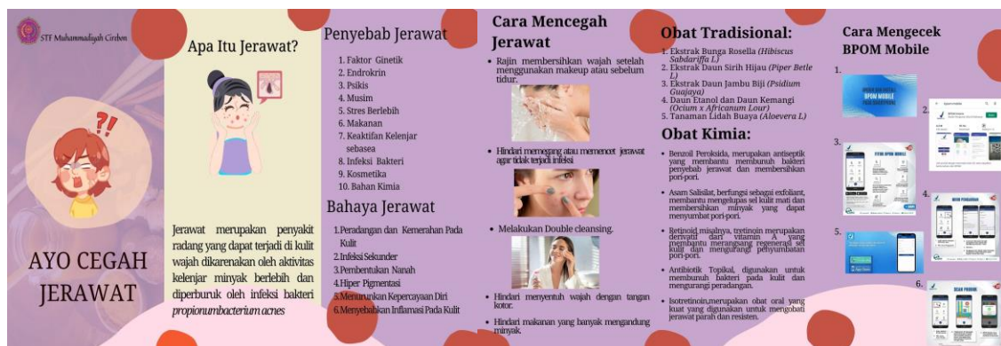
Gambar 2. Brosur tentang jerawat

Kegiatan dilanjut dengan pembagian atau penyebaran brosur yang berisikan tentang definisi jerawat, penyebab jerawat, bahaya jerawat, pencegahan jerawat, obat tradisional serta obat kimia jerawat dan cara mengecek registrasi kosmetika menggunakan aplikasi BPOM mobile. Brosur dapat dilihat pada Gambar 2. Kegiatan dilanjutkan dengan sesi tanya jawab, dimana siswa SMK Rise Kedawung bertanya mengenai jerawat dan cara pengecekan registrasi BPOM pada skincare maupun make up (Gambar 3).