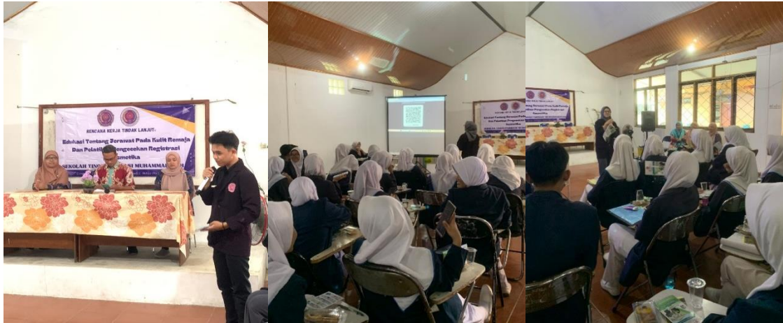
Gambar 1. Penyampaian materi tentang jerawat

Kegiatan dilanjut dengan pembagian atau penyebaran brosur yang berisikan tentang definisi jerawat, penyebab jerawat, bahaya jerawat, pencegahan jerawat, obat tradisional serta obat kimia jerawat dan cara mengecek registrasi kosmetika menggunakan aplikasi BPOM mobile. Brosur dapat dilihat pada Gambar 2. Kegiatan dilanjutkan dengan sesi tanya jawab, dimana siswa SMK Rise Kedawung bertanya mengenai jerawat dan cara pengecekan registrasi BPOM pada skincare maupun make up (Gambar 3).