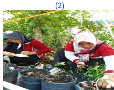
Proses pemindahan bibit desa oleh Tim Pelaksana