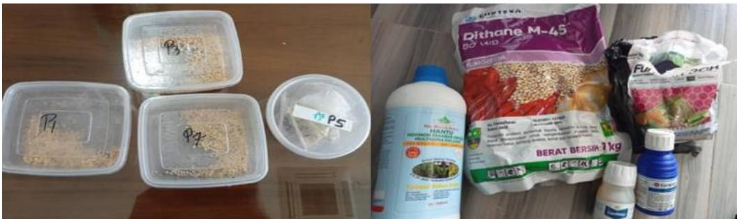
Gambar 2. Benih cabai dan bahan

Kegiatan penyiapan benih cabai hibrida, dilaksanakan dengan memilih tetua benih cabai hibrida yaitu UNIB C H73. Kemudian dipersiapkan alat dan bahan yang diperoleh dari toko/kios pupuk sekitar Kota Bengkulu (Gambar 2). Sebelumnya, Pemerintah Desa Lawang Agung selaku mitra mengajukan proposal permintaan jangkos kosong kepada PT. Agri Andalas. Selang beberapa hari, perusahaan menyetujui permintaan tersebut mengingat desa Lawang Agung adalah desa penyangga. Sementara kompos yang disediakan adalah sebanyak satu truk (Gambar 3). Pilihan ini didasarkan pada studi Nabayi et al. (2018) yang meyakini bahwa media tanam organik seperti halnya jangkos memberikan pertumbuhan paling baik dibanding bahan-bahan lainnya.