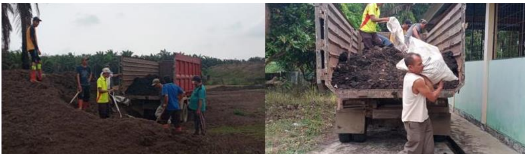
Gambar 3. Pengangkutan kompos jangkos dari PT. Agri Andalas, Selama