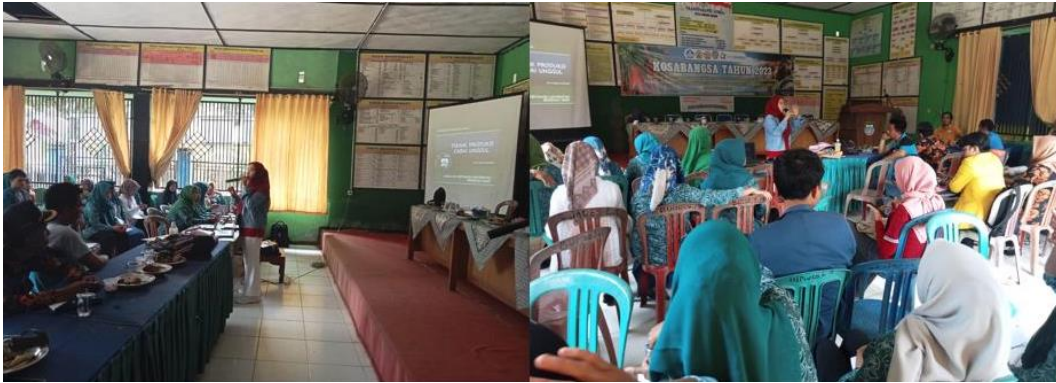
Gambar 1. Pelatihan pembenihan dan pembibitan cabai hibrida UNIB

telah disampaikan oleh narasumber tentang pembenihan dan pembibitan cabai hibrida untuk selanjutnya menyiapkan benih, bahan dan peralatan.