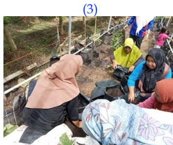
Proses pemindahan bibit oleh ibu-ibu Kader PKK Desa Lawang Agung