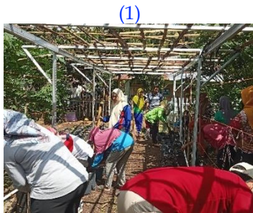
Proses pembersihan naungan dan lahan di Kebun Bibit Desa