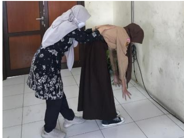
Gambar 1. Edukasi pencegahan AIS

edukasi dilakukan melalui media buku saku dan video yang berisi materi tentang definisi AIS, pemeriksaan fisik AIS dan langkah pencegahan melalui exercise koreksi postur dan penggunaan tas yang benar seperti yang ditunjukkan pada Gambar 2 dan Gambar 3.