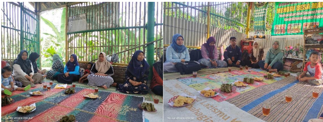
Gambar 1. Kegiatan sosialisasi

Kegiatan sosialisasi yang dilakukan yaitu untuk memberikan pemahaman awal mengenai tugas dan fungsi bank sampah dalam mendukung kesejahteraan masyarakat. Tahap-tahap dalam pelaksanaan kegiatan sosialisasi ini yaitu berkoordinasi dengan ketua Bank Sampah Tangguh untuk menentukan waktu, tempat dan mekanisme dalam mengundang pengurus. Setelah itu dilanjutkan dengan koordinasi dengan sejumlah narasumber yang akan memberikan materi terkait pentingnya organisasi masyarakat khususnya bank sampah. Kegiatan sosialisasi ini dilaksanakan pada hari Sabtu, 15 Juli 2023 dengan melakukan pelatihan yang dihadiri oleh ibu-ibu pengurus Bank Sampah Tangguh di Dusun Wonosuko sebagaimana ditunjukkan pada Gambar 1.