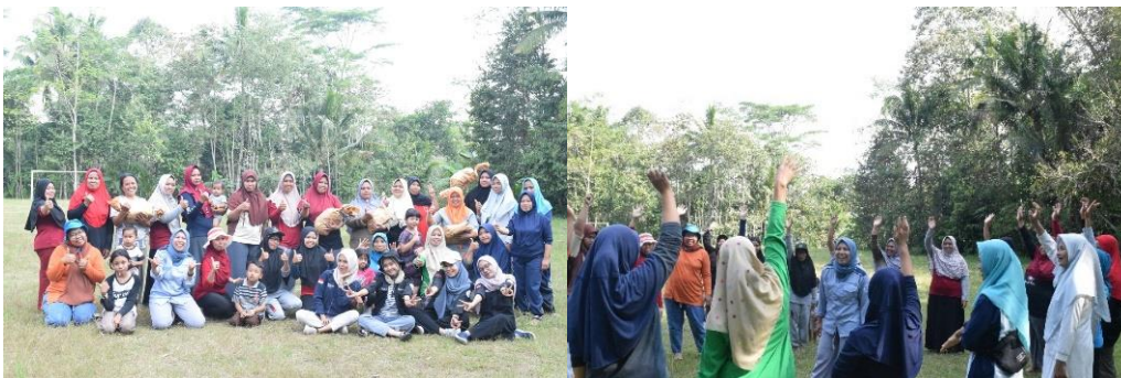
Gambar 4. Kegiatan outbond dan pemberian apresiasi kepada pengurus bank sampah

Setelah selesai kegiatan, tim melakukan refleksi bersama seluruh peserta. Hasil refleksi tersebut menunjukkan bahwa seluruh peserta menikmati kegiatan tersebut. Mereka juga menyampaikan bahwa kegiatan ini membantu meningkatkan keterampilan kerja sama di antara pengurus. Kegiatan ini juga perlu dimasukkan sebagai salah satu program kegiatan tahunan.