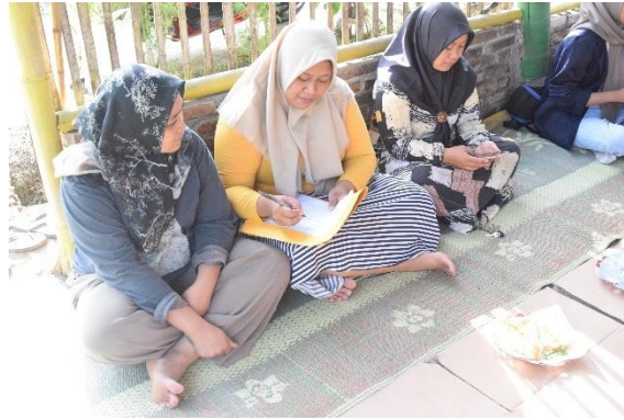
Gambar 3. Peserta kegiatan pendampingan

dari kegiatan ini adalah tersusunnya timeline setiap program dan mekanisme pelaksanaan yang lebih rinci sehingga realisasi pelaksanaan program meningkat.