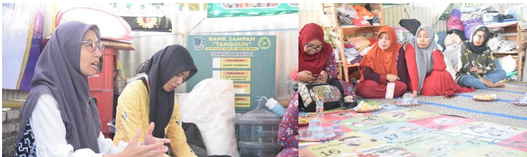
Gambar 2. Kegiatan pelatihan program kerja bank sampah