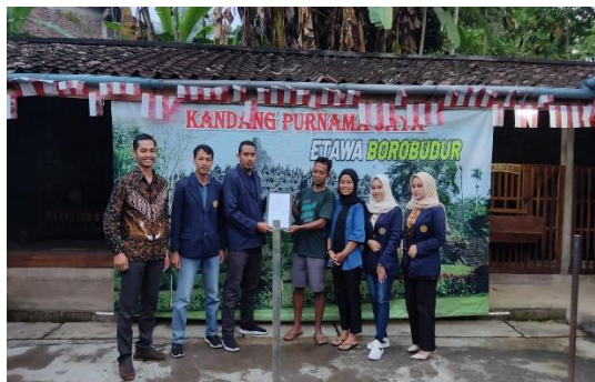
Gambar 3. Penyerahan dokumen NIB

Pada Gambar 3 dibawah ini dilakukan penyerahan dokumen NIB setelah dilakukan pendampingan oleh tim pengabdian. Manfaat dari program ini menunjukkan bahwa mitra dapat meningkatkan pemahaman terkait seluk-beluk dan manfaat PIRT, dibuktikan dengan pengisian pre-test dan pos-test . Selain itu, mitra dapat melakukan pendaftaran NIB sesuai dengan prosedur dan syarat yang diperlukan. Mitra didampingi tim PPMT juga berhasil memperoleh dokumen ijin NIB dari Menteri Investasi/Kepala badan Koordinasi Penanaman Modal Republik Indonesia.