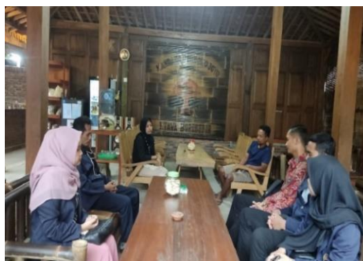
Gambar 4. Pemasaran Produk

Pelaksanaan penyuluhan tentang pemasaran produk ini pada tanggal 31 Juli 2022 dan 1 Agustus 2022. Sedangkan pendampingan tentang pemasaran produk ini dilaksanakan pada tanggal 18 dan 20 Agustus 2022. Kegiatan ini juga bertempat pada mitra pengabdian dan juga dihadiri mitra pengabdian. Penyuluhan dilakukan oleh tim pengabdian secara bergantian hal ini dapat dilihat pada Gambar 4 di bawah ini.