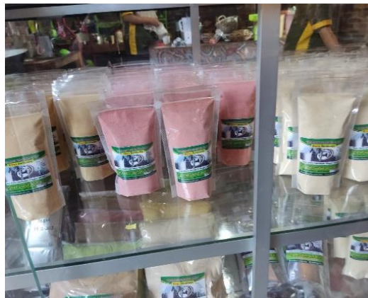
Gambar 1. Salah Satu Produk Obyek Wisata Edukasi dan Resto “Kandang Purnama Jaya” Berupa Susu Bubuk

Persaingan saat ini sudah semakin ketat dengan bermunculannya berbagai jenis industri wisata dan resto, baik di sekitar Magelang maupun di luar Magelang. Jika tidak dikelola dengan baik, mulai dari legalitas usahanya, pengelolaan produk yang dihasilkannya, dan juga sistem pemasarannya maka usaha yang berbasis rumah tangga (UMKM) akan mengalami kemunduran.