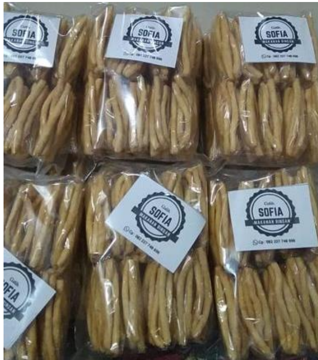
Gambar 1. Sampel kemasan produk Cistik Sofia

penggunaan tenaga kerjanya adalah tenaga kerja keluarga dengan jumlah tenaga kerja kurang lebih sembilan orang. Khusus dalam produksi pangan ini, salah satu warga yang menggeluti usaha chesse stick memberi label merk dagangnya dengan Cistik Sofia disajikan pada Gambar 1. Yang mana, Cistik Sofia ini masuk dalam kategori makanan ringan skala rumah tangga yang masih bersifat tradisional, baik dalam proses produksi maupun pemasarannya. Cistik Sofia dipasarkan di sekitar rejoyinangun, gotongroyong, tegalrejo dan daerah sekitar Magelang lainnya, satu pack Cistik Sofia dijual dengan harga Rp. 7500. Penjualan perhari mencapai t 50 pack, jika dijumlahkan rata-rata perbulan Cistik Sofia menghasilkan 11.250.000 rupiah.