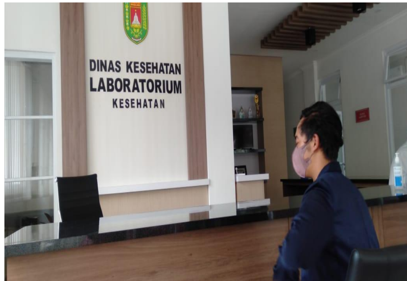
Gambar 4. Proses pendaftaran uji laboratorium produk Cistik Sofia

Kemudian, tahapan lain dalam proses pengajuan SPP-IRT sesuai rekomendasi dari Dinkes, Tim PPMT diberikan surat pengantar ke Puskesmas Tegalrejo untuk dilakukannya pengecekan sanitasi usaha Gambar 5. Pada tahapan ini, tiga orang petugas dari Puskesmas melakukan pengecekan dalam proses produk Cistik Sofia. Selain dalam Tim PPMT mendampingi mitra dalam proses pembuatan NPWP sebagai salah satu kelengkapan pengajuan SP-PIRT.