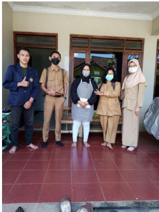
Gambar 5. Inspeksi sanitasi IRTTP oleh petugas puskesmas Tegalrejo

Kemudian, tahapan lain dalam proses pengajuan SPP-IRT sesuai rekomendasi dari Dinkes, Tim PPMT diberikan surat pengantar ke Puskesmas Tegalrejo untuk dilakukannya pengecekan sanitasi usaha Gambar 5. Pada tahapan ini, tiga orang petugas dari Puskesmas melakukan pengecekan dalam proses produk Cistik Sofia. Selain dalam Tim PPMT mendampingi mitra dalam proses pembuatan NPWP sebagai salah satu kelengkapan pengajuan SP-PIRT.