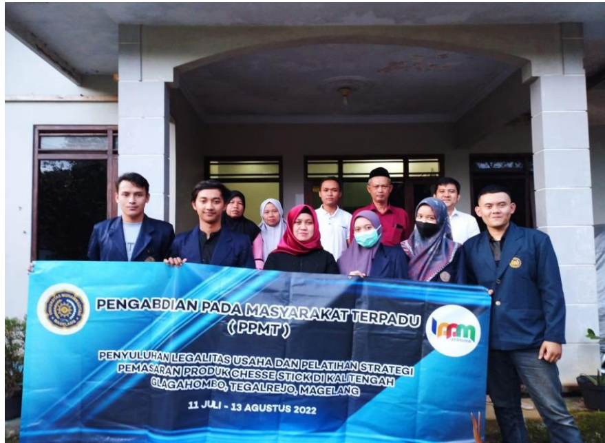
Gambar 3. Acara pembukaan, penandatanganan perjanjian dan pemaparan program

Pada tanggal 16 Juli 2022 kegiatan PPMT Batch V Desa Kalitengah diawali dengan acara pembukaan, penandatanganan kesediaan kerjasama dan penyampaian program. Dalam pelaksanaan pembukaan ini, selain Tim PPMT dan mitra juga dihadiri oleh Kepala Dusun, Ketua Pemuda dan perwakilan masyarakat sebagaimana disajikan dalam Gambar 1. Pada acara pembukaan Tim PPMT melakukan sosialisasi keseluruhan kegiatan kepada mitra.