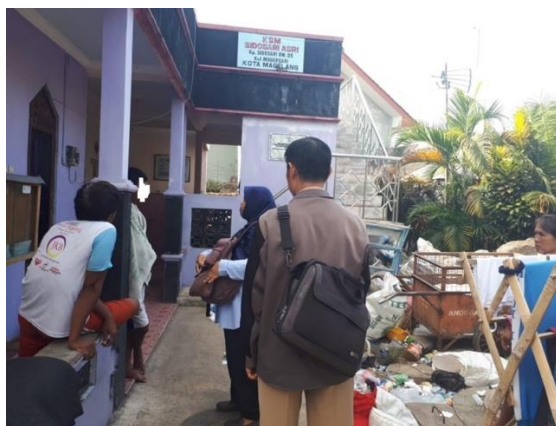
Gambar 5. Penyelesaian Kasus Kekerasan oleh Tim PPMT

Permasalahan kedua adalah kenakalan remaja Desa Magersari yang melakukan pemalakan (pemerasan) terhadap masyarakat di Desa lain. Melalui pendampingan tim, anak tersebut memahami kesalahannya dan berjanji untuk tidak melakukan pemalakan Kembali. Anak tersebut diwajibkan untuk menandatangani perjanjian bermaterai yang dibuat oleh tim.