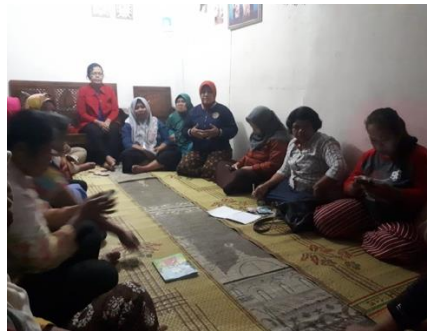
Gambar 7. Sosialisasi mengenai Pembagian Waris