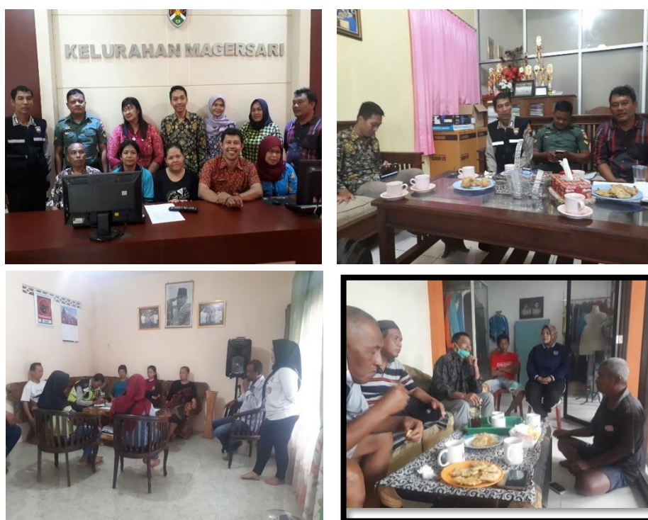
Gambar 10. Pemberdayaan LKM dalam Mengatasi Konflik Sosial

Posjikum juga memberdayakan LKM dalam penyelesaian permasalahan hukum yang terjadi di Kelurahan Magersari.