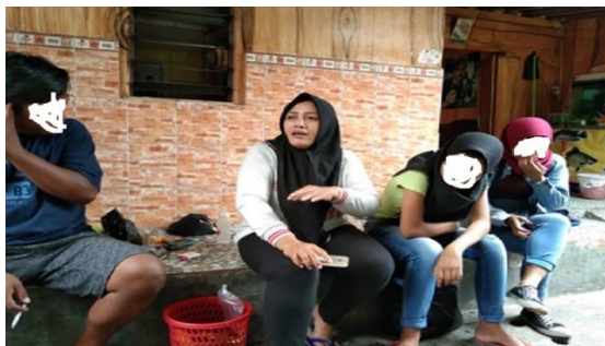
Gambar 4. Penyelesaian Konflik Anak di Bawah Umur

Saat pelaksanaan kegiatan Posjikum, masyarakat sangat antusias. Selama pelaksanaan kegiatan, ada dua permasalahan hukum di masyarakat Desa Magersari yang terselesaikan dengan bantuan dari Posjikum. Keseluruhan dari permasalahan hukum tersebut terselesaikan dengan mediasi kedua belah pihak yang berselisih. Permasalahan pertama adalah perkelahian yang dilakukan oleh anak perempuan di bawah umur terhadap anak STM Negeri Cawang. Upaya penyelesaian dari tim Posjikum mendapatkan hasil damai antara kedua belah pihak.