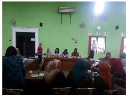
Gambar 8. Pelatihan Penghitungan Wakaf dan Zakat oleh Ibu - Ibu PKK