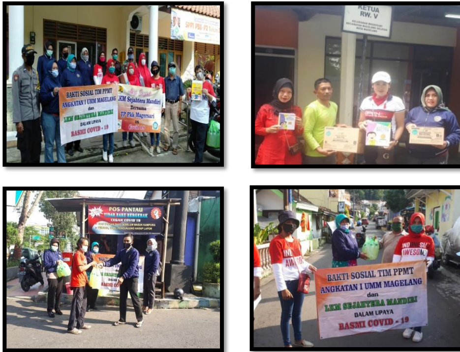
Gambar 11. Tim PPMT Peduli Covid

Kegiatan Baksos ini dinamakan “PPMT Peduli Covid” sebagai upaya pencegahan penularan Covid-19.