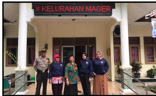
Gambar 2. Koordinasi dan Permohonan Izin dengan Mitra

Persiapan dilakukan dengan observasi wilayah mitra dan memohon izin untuk melaksanakan kegiatan PPMT di Kelurahan Magersari. Berdasarkan hasil observasi, wawancara, dan diskusi dengan pihak Kelurahan dan Babinkamtibmas Magersari, pihak mitra memiliki program untuk mengatasi konflik sosial dengan membentuk Forum Kemitraan Perpolisian Masyarakat (FKPM) untuk mengatasi konflik sosial di kelurahan Magersari. Namun demikian, forum tersebut sudah cukup lama tidak aktif dikarenakan kesibukan dan kurangnya sosialisasi dari pihak kepolisian terkait penanganan konflik sosial. Untuk itu, tim PPMT berusaha untuk memebrdayakan Lembaga Keswadayaan Masyarakat (LKM) untuk dilatih dalam penanganan konflik sosial. Kehadiran tim PPMT disambut baik oleh pihak mitra sekaligus memberikan izin untuk melaksanakan program PPMT di Kelurahan Magersari.