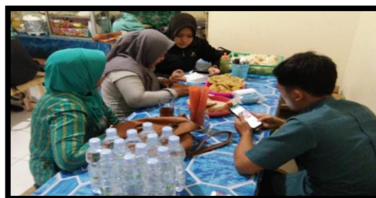
Gambar 3. Koordinasi Pembuatan Posjikum

Setelah mendapatkan izin dari pihak Mitra, Tim PPMT segera membentuk POSJIKUM sebagai sarana konsultasi bagi masyarakat Desa Magersari yang membutuhkan bantuan terkait dengan permasalahan hukum. Anggota POSJIKUM ini adalah Tim PPMT yang bergerak untuk memberikan bantuan berupa pelatihan pembuatan draf dokumen – dokumen hukum, melaksanakan pendampingan dan pemberdayaan masyarakat untuk melatih LKM di Desa Magersari.