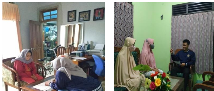
Gambar 9. Pendampingan Pembuatan Dokumen Hukum

Posjikum juga memberdayakan LKM dalam penyelesaian permasalahan hukum yang terjadi di Kelurahan Magersari.