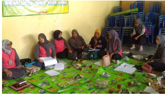
Gambar 6. Sosialisasi mengenai Mediasi