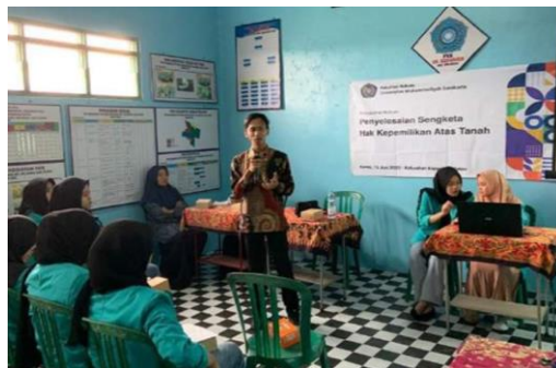
Gambar 2. Pembukaan

Kegiatan penyuluhan diawali dengan pembukaan, dalam serangkaian pembukaan diawali sambutan dari pihak kelurahan (Gambar 2), dalam sambutannya beliau menyampaikan bahwa kegiatan ini sangat ditunggu oleh masyarakat, karena dalam praktiknya banyak masyarakat yang belum memahami terkait bagaimana penyelesaian sengketa tanah, ditambah lagi banyak sekali praktik jual beli tanah yang tidak menggunakan dokumen resmi hanya berdasarkan asas kepercayaan saja, sehingga ketika salah satu pihak melakukan wanprestasi, mereka akan kesulitan untuk membuktikannya. Sambutan hangat yang diberikan oleh warga sangat luar biasa.